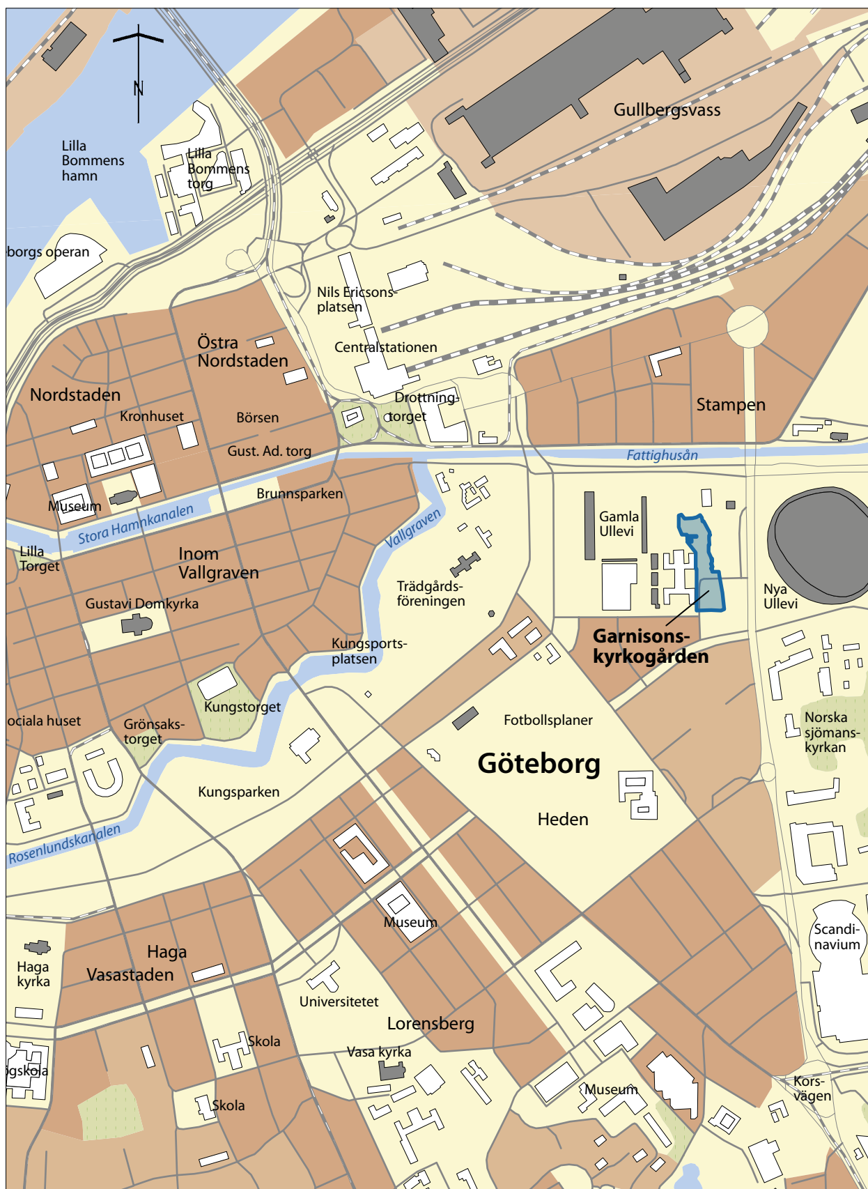
Figur 2. Garnisonskyrkogårdens utbredning på Fastighetskartan, blad 07B0E Göteborg (RT 90). Skala 1:10 000.