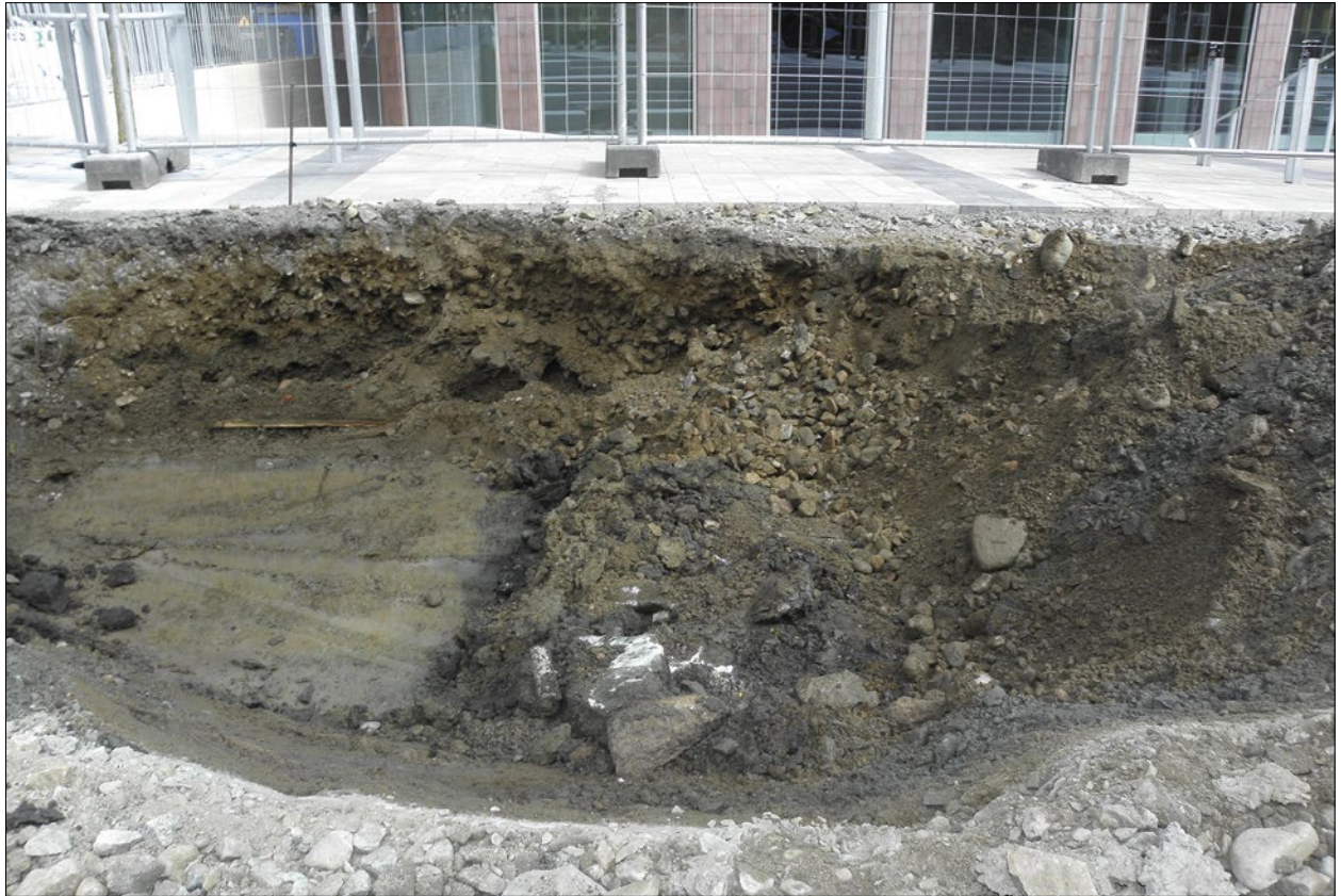
Figur 7. I schaktet TK S6 syns kyrkogårdsmuren. Kyrkogårdsmuren var också synlig i spontschakt 2 för huset i bakgrunden.