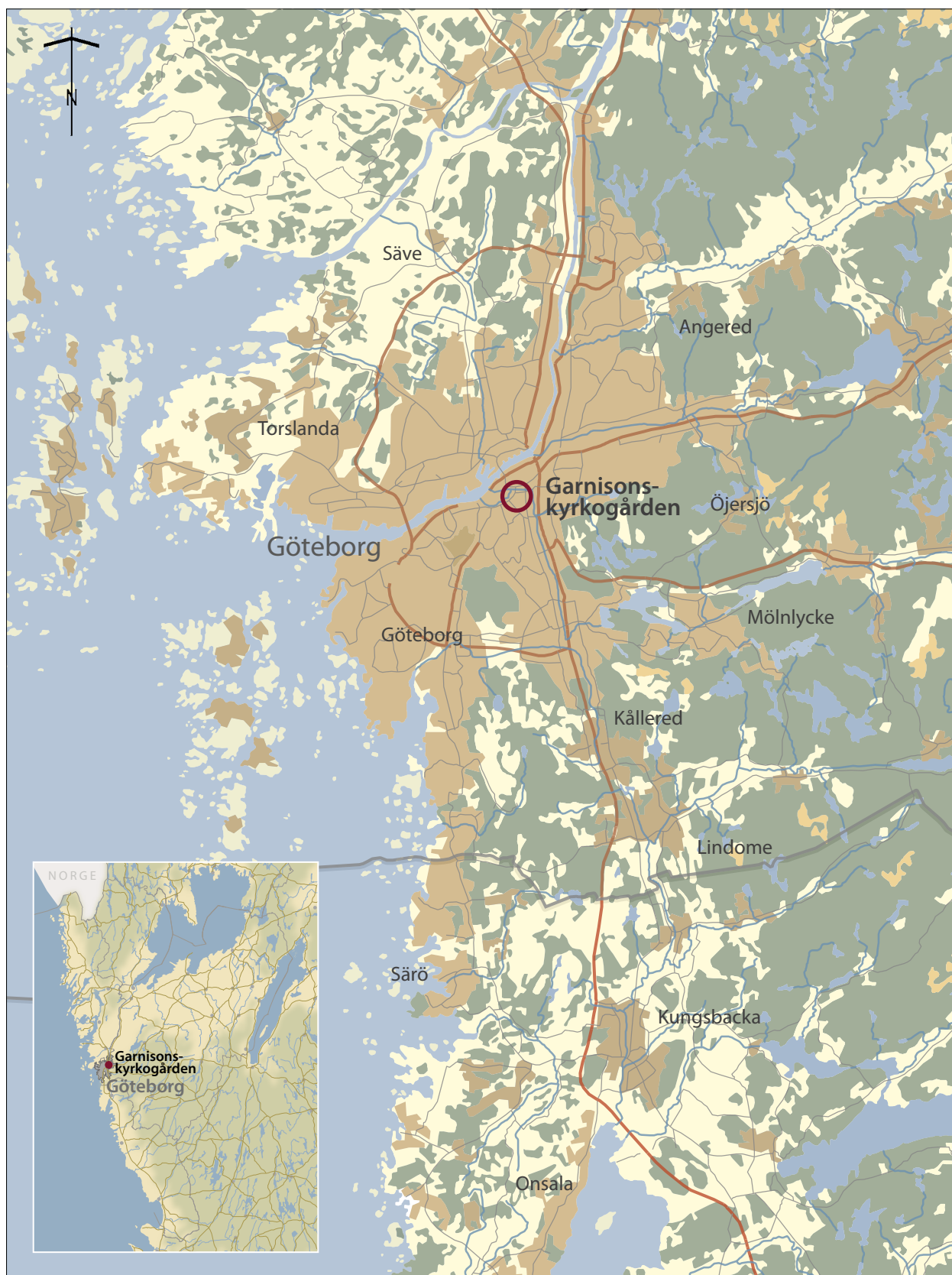
Figur 1. Läget för förundersökningen markerat på utsnitt ur Översiktskartan, blad 253 Göteborg (Sweref99 TM, 1:250 000) och GSD-Sverigekartan.