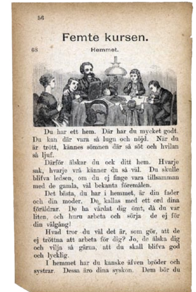
Ur Första läsåret: Abc- och läsebok Får far sy och mor läsa högt? Vem gör vad i det goda hemmet?

Tanken med en ABC- eller läsebok är i första hand att lära oss att läsa. Men den speglar också samhällets värderingar och hur dessa förändras. I böckerna kan vi följa olika tidsperioders syn på könsroller, moral, och det goda samhället. Vad lärde du dig av din läsebok?