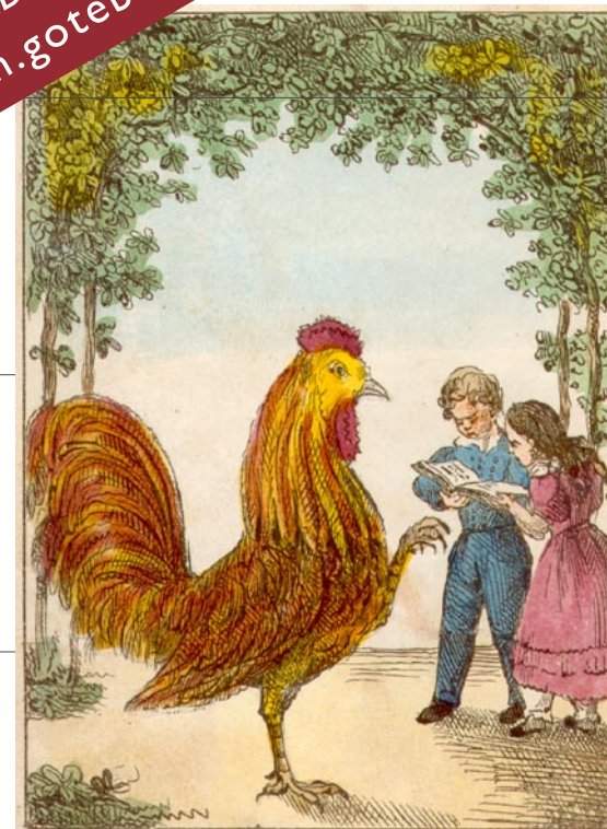
ur ABC- och läsebok för snälla barn.

VÄLKOMMEN på en resa i ABC-bokens värld på www.stadsmuseum.goteborg.se