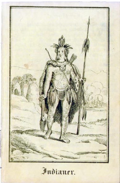
ur Ny ABC och läsebok med åtta bilder. Vilken bild har barn i olika tider fått av sin omvärld?