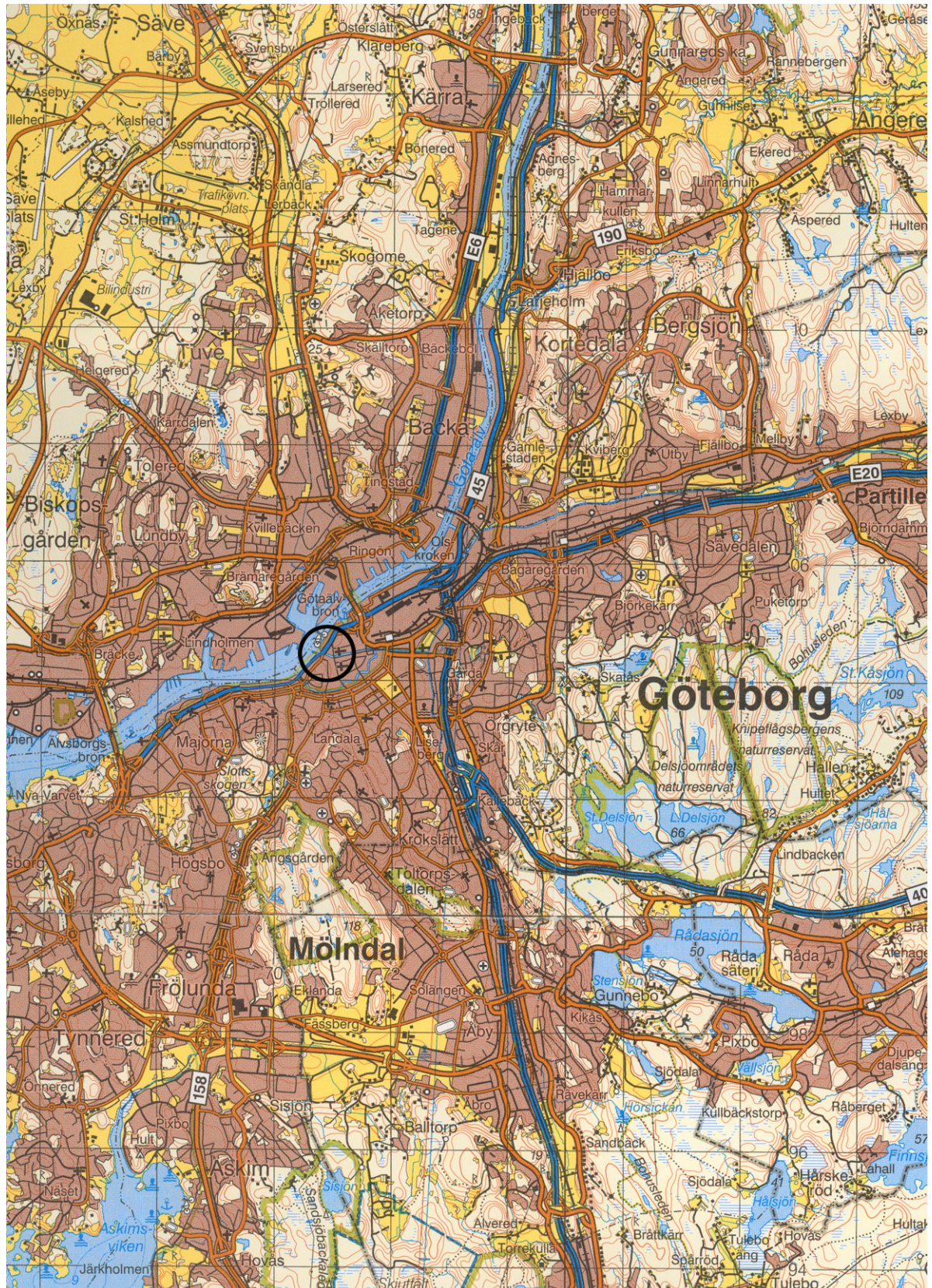
Figur 1. Undersökningsrådets läge i centrala Göteborg. Blå kartan, skala 1:100 000.