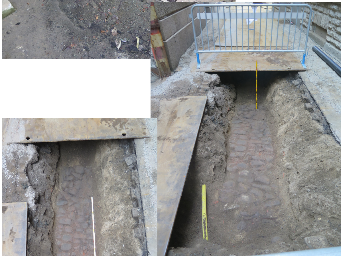
Figur 5 och 6. Översikt över den bevarade stenläggningen från 1600-tal/1700-tal. Foto mot väster.