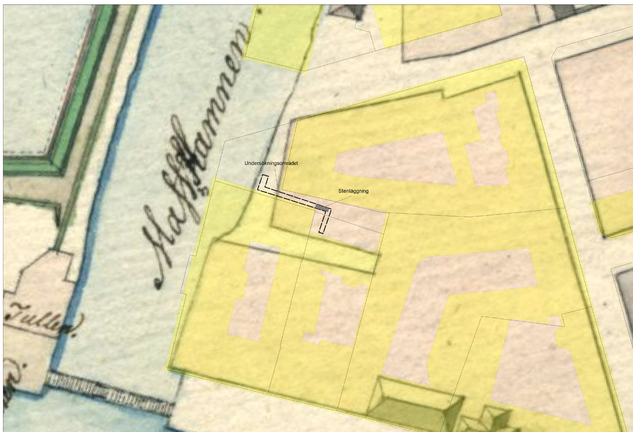
Figur 7. Undersökningsområdet med stenläggning på karta från 1795. Stenläggningen ligger tydligt i en äldre gårdsmiljö.