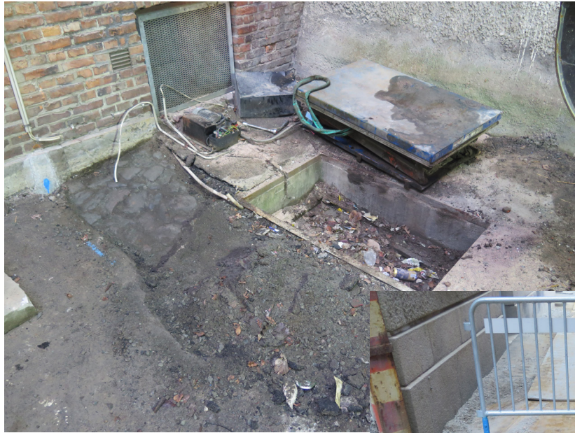
Figur 4. Översikt över schaktets södra del. Här påträffades 1800-tals stenläggning bestående av oregelbundna stenar. Foto mot sydväst.