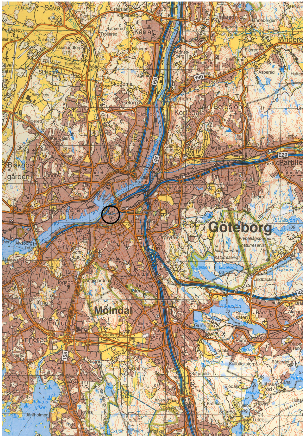
Figur 1. Undersökningens plats markerad med cirkel på Blå kartan, skala 1:100 000.