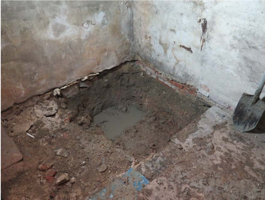
Figur 2. Översikt över schakt 1 mot nordost.