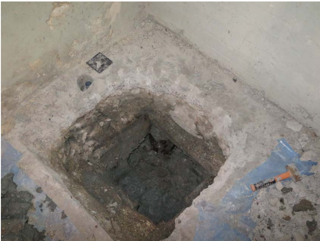
Figur 3. Översikt över schakt 2 mot sydväst.