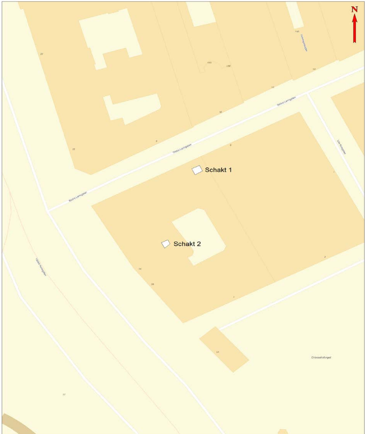
Figur 1. Positionen för aktuella schakt vid inför undersökning av grundläggning.