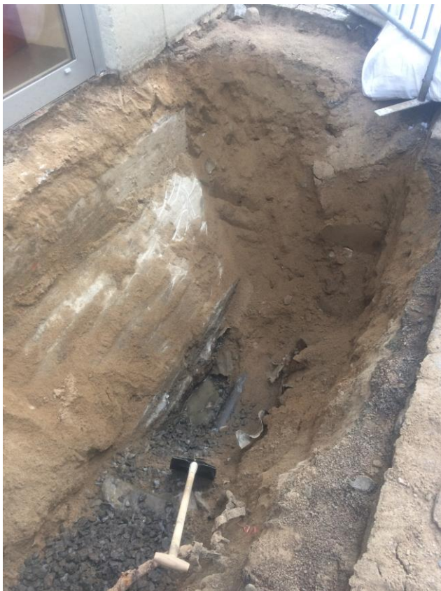
Figur 5. Provgrop 1 mot nordost.