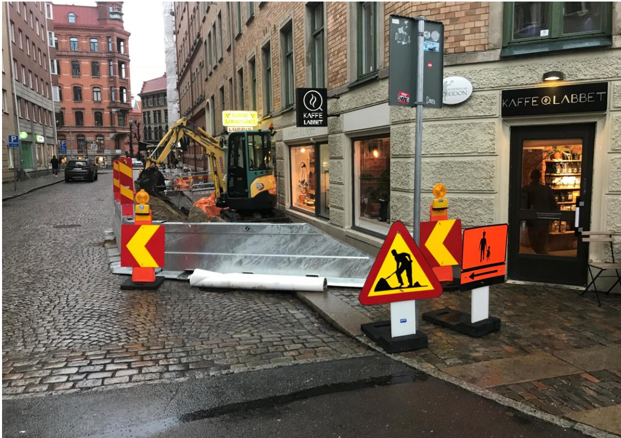
Figur 4. Översiktbild över Frigångsgatan vid grävande av provgrop 2, foto mot väster av Johan Téenhäll.