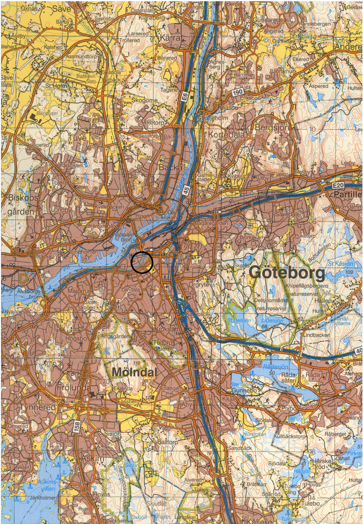
Figur 1. Karta över centrala Göteborg med platsen för undersökningen markerad. Blå kartan, skala 1:100 000.