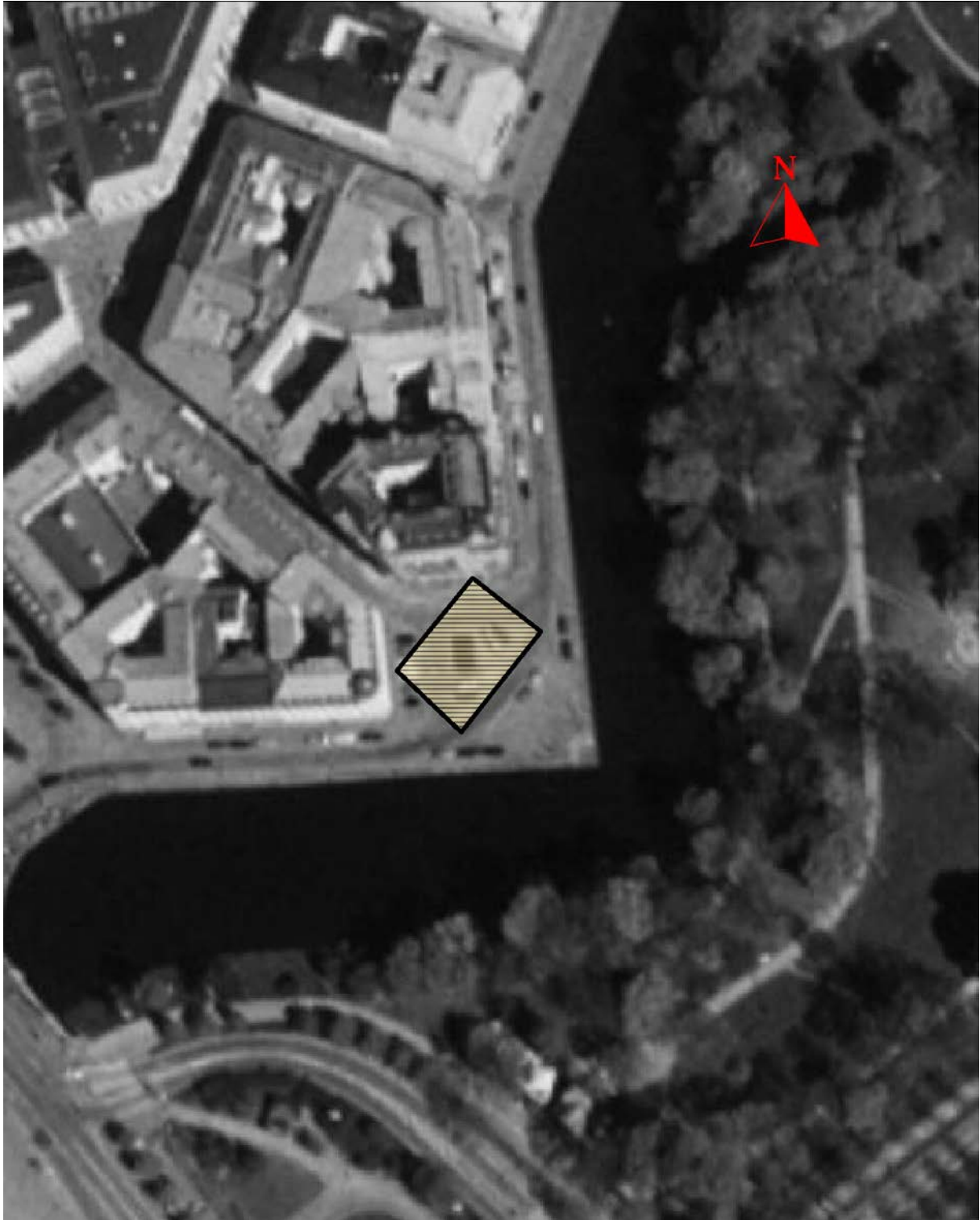
Figur 3. Ortofoto över Bastionsplatsen från 2002 med undersökningsområdet markerat. Skala 1:1000.