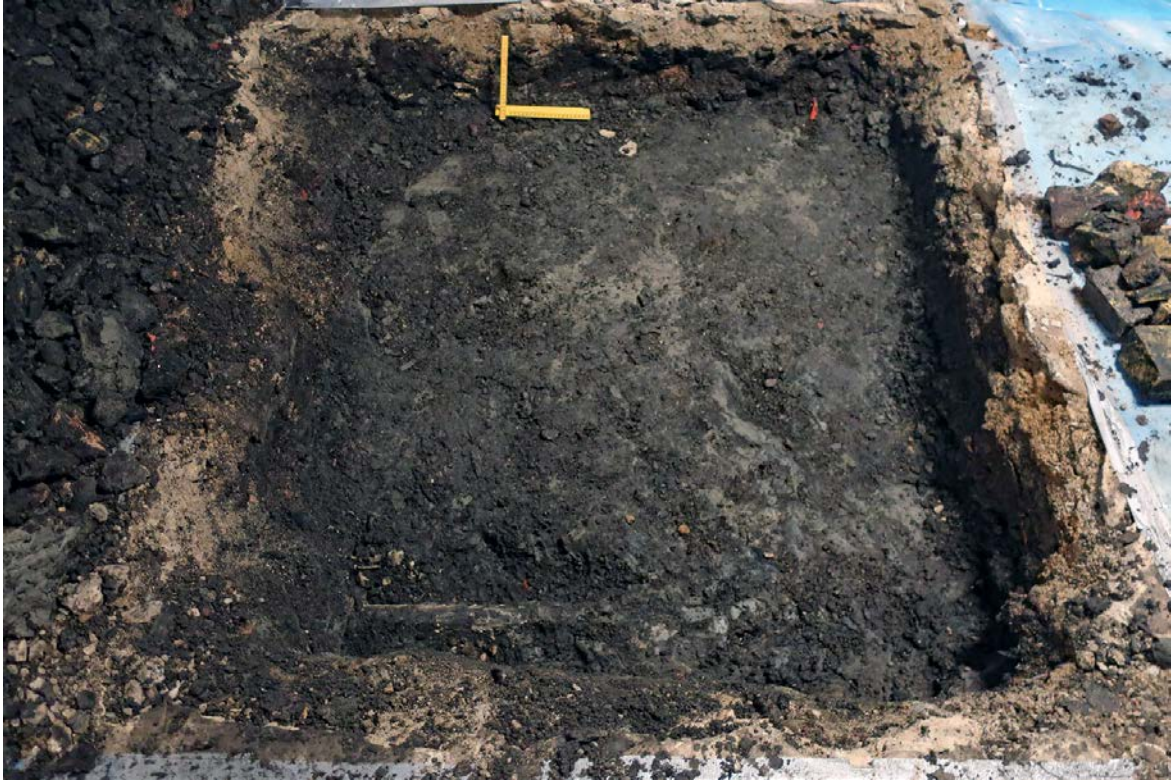
Figur 5. Den gropiga övre delen av PG1L2 i schakt 1. Foto mot sydsydost.