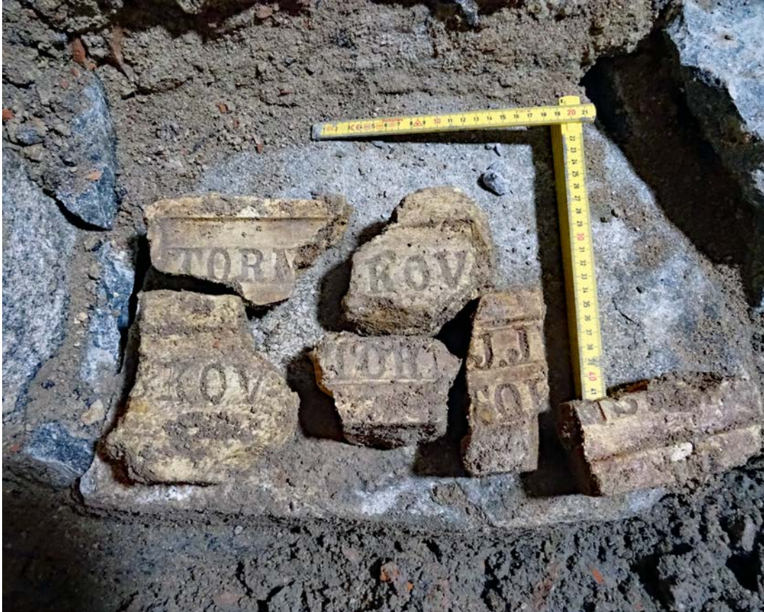
Figur 9. Ett urval av det tegel som framkom i PG3L1.