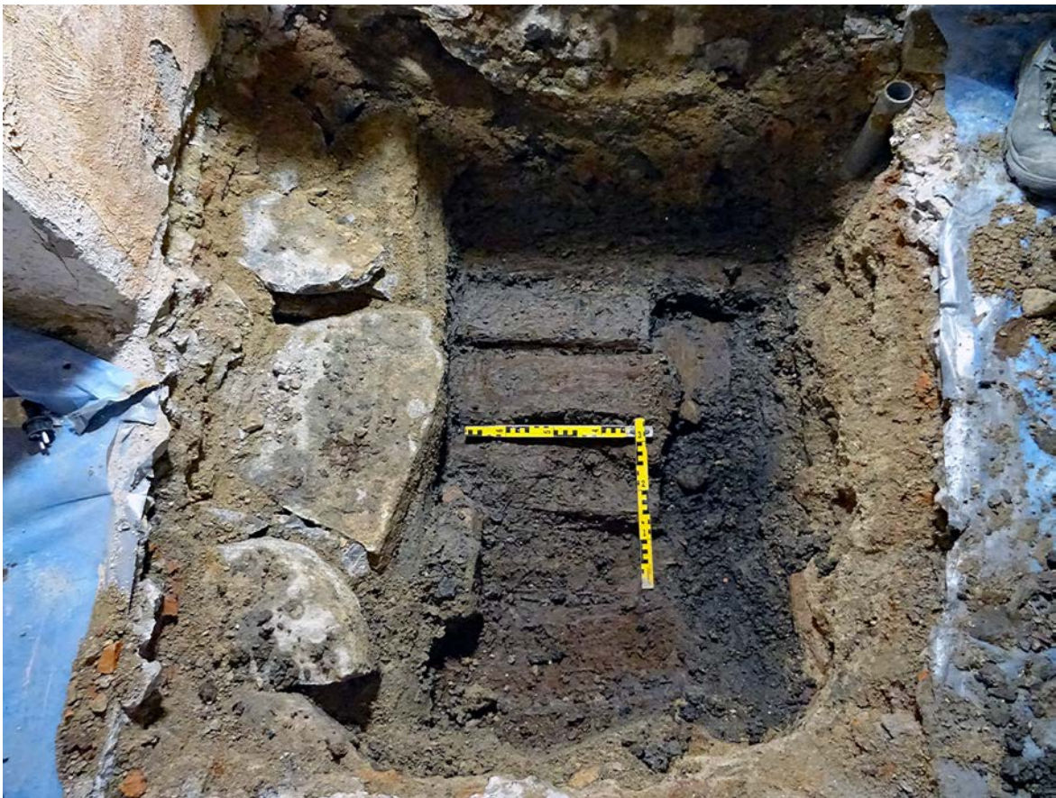
Figur 8. Schakt 3 med delar av grundmuren och tillhörande rustbädd synliga. Foto mot nordnordväst.