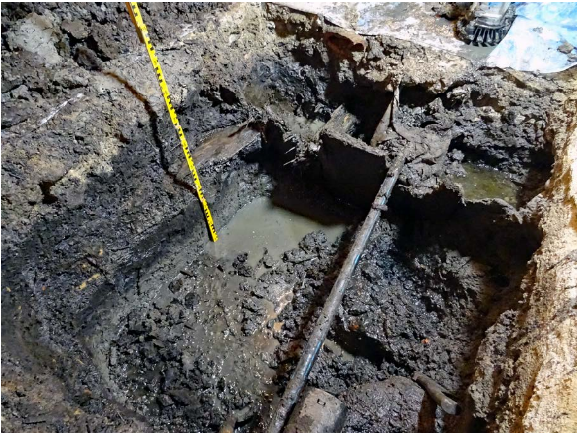
Figur 6. Översiktsbild över schakt 2 med avfallsbingens stående plankor frilagda och den underliggande mörkfärgade markhorisonten i profil. Foto mot sydväst.