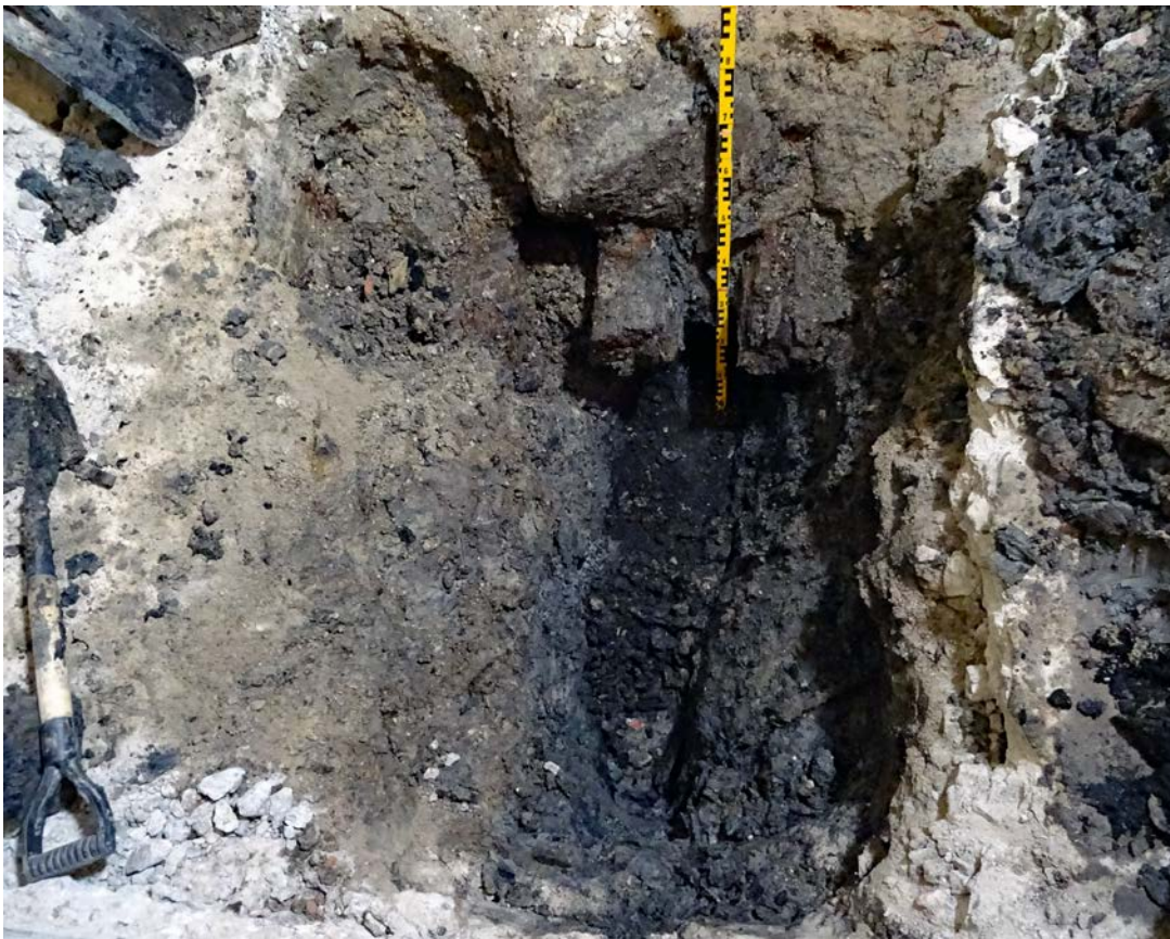
Figur 10. Schakt 4 med grundmur och rustbädd synlig i schaktväggen samt den äldre mörkfärgade markhorisonten i botten. Foto mot sydost.