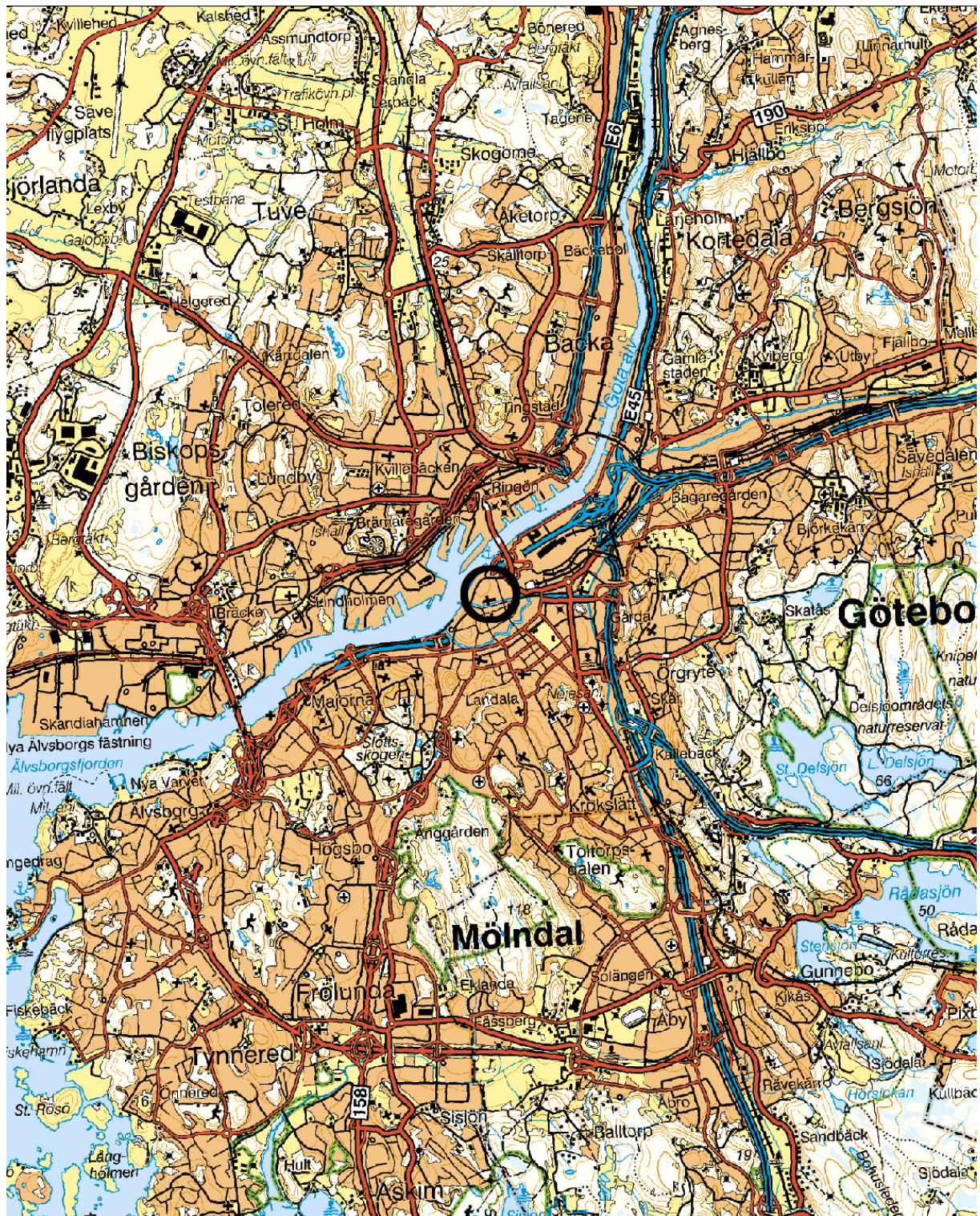
Figur 1. Undersökningens läge i centrala Göteborg. Blå kartan. Skala 1:100 000.