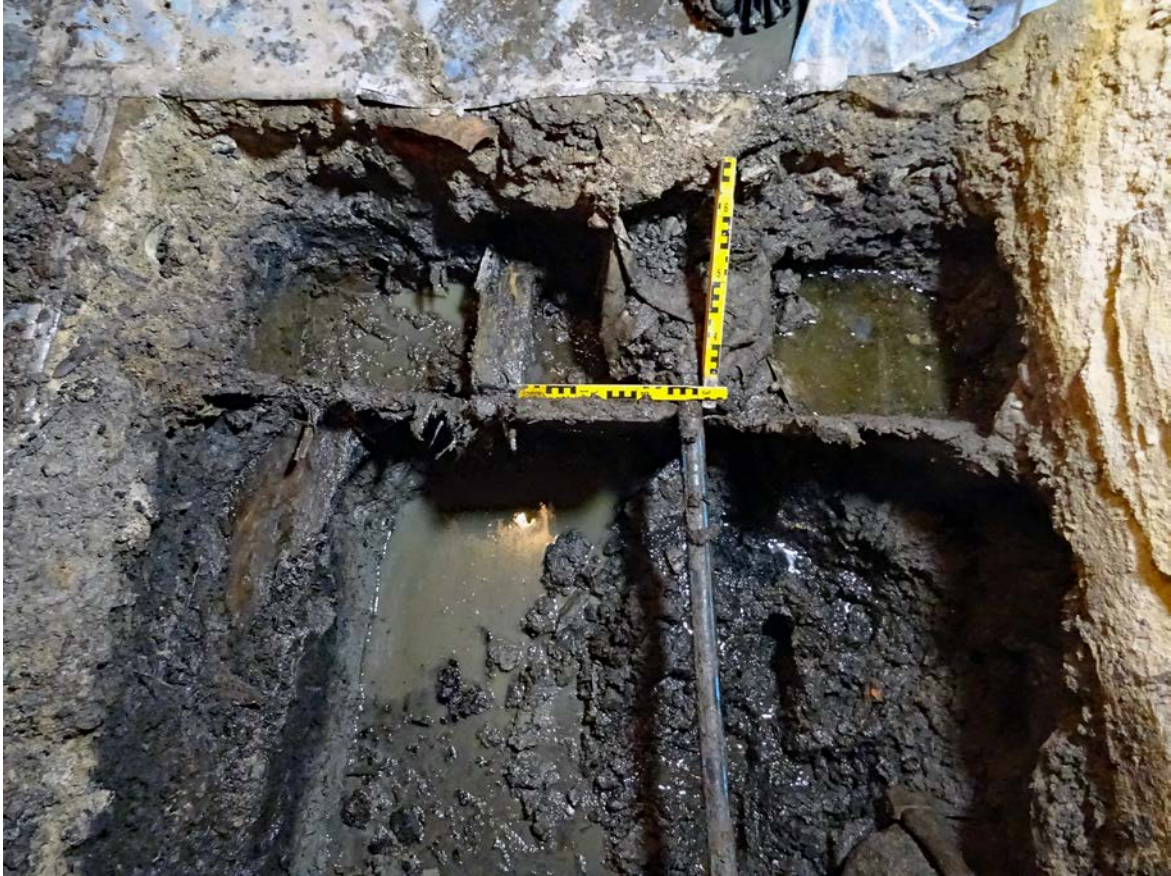
Figur 7. Den påträffade träkonstruktionen från schakt 2 i plan. Foto mot väst.