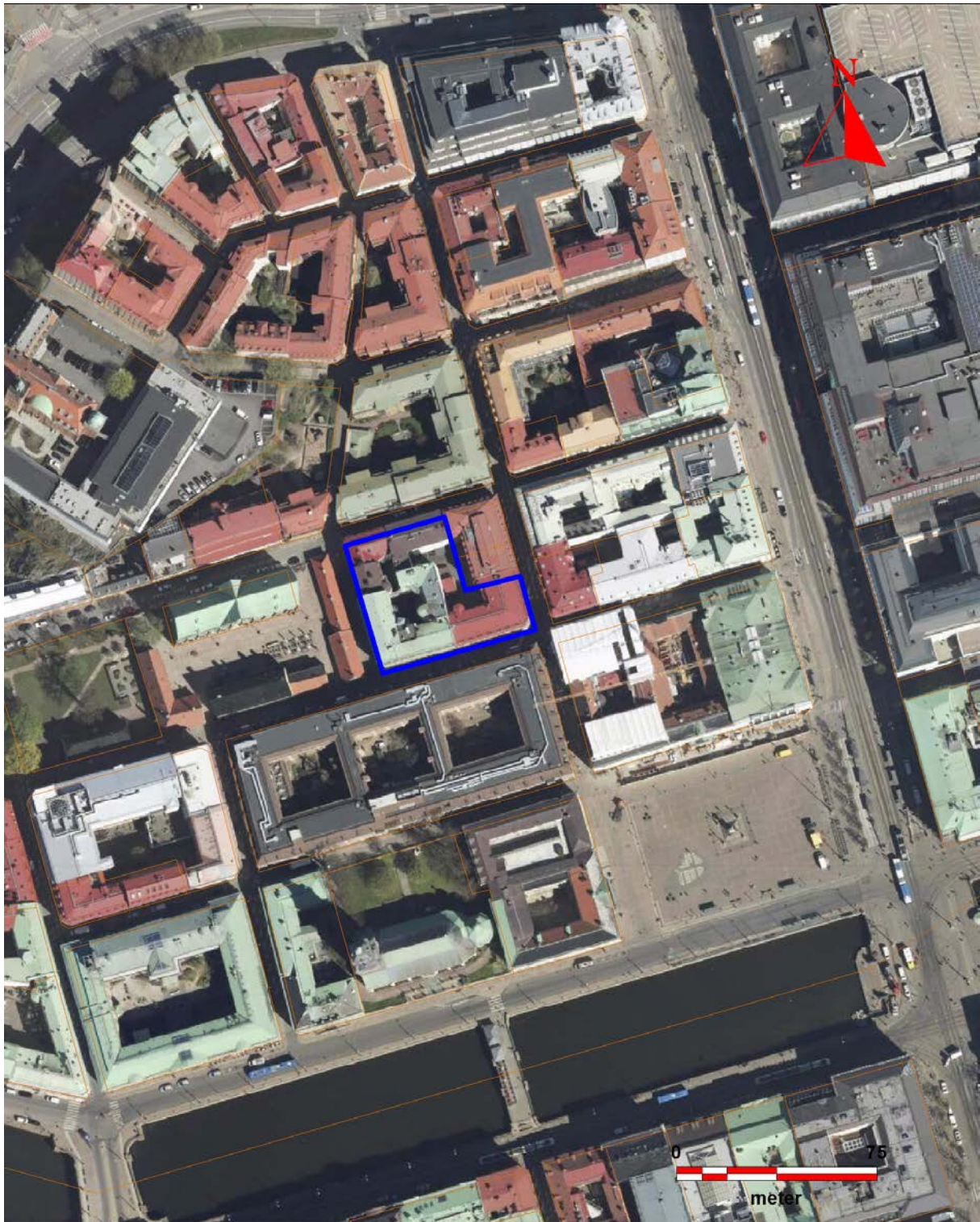
Figur 2. Ortofoto med den aktuella fastigheten Nordstaden 18:1 markerat (blå), strax nordväst om Gustav Adolfs torg i Göteborgs centrum. Skala 1:2500.