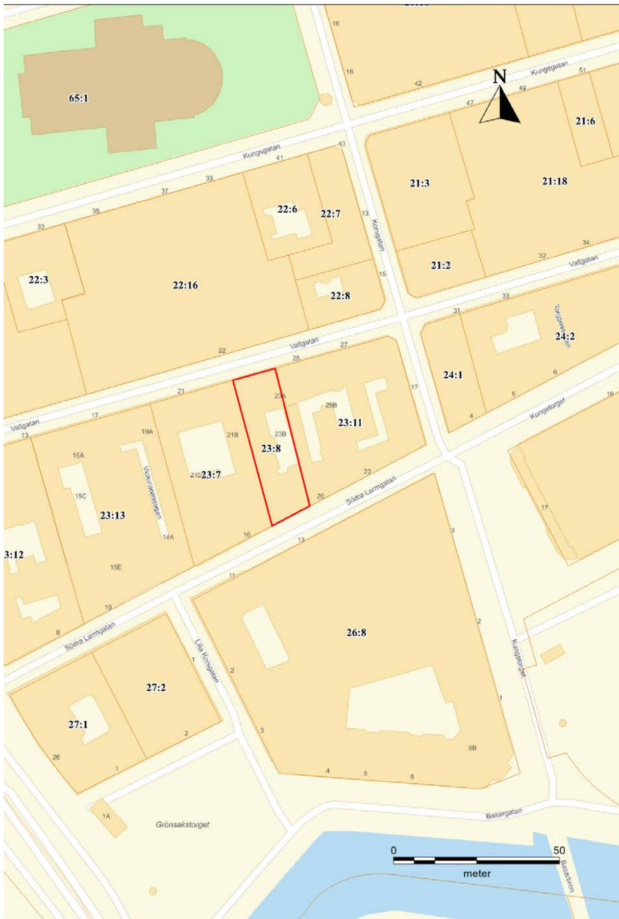
Figur 2. Karta över kv. Larmtrumman och närliggande fastigheter samt Göteborgs domkyrka i nordväst. Aktuell fastighet, Inom Vallgraven 23:8, markerad (röd). Skala 1:1000