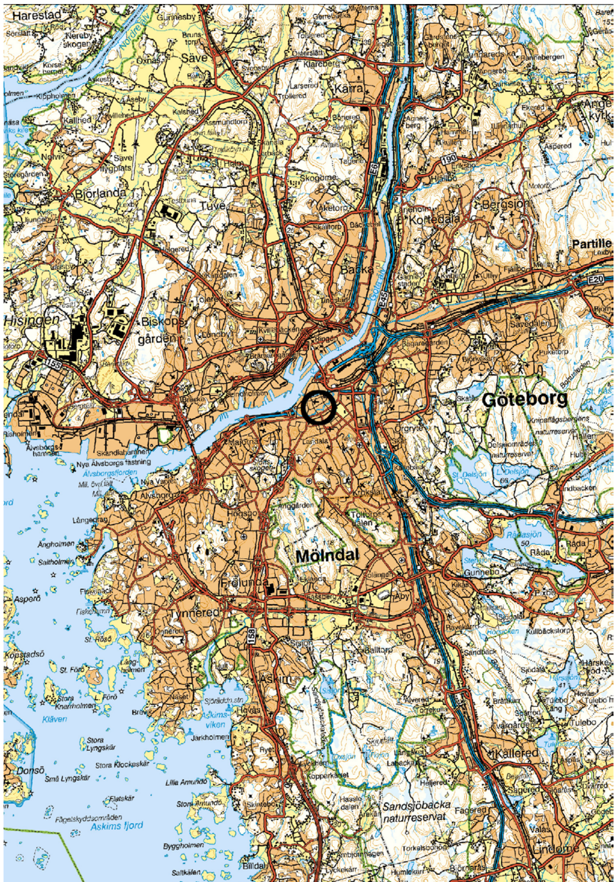
Figur 1. Karta över centrala Göteborg med platsen för undersökningen markerat. Blå kartan. Skala 1:100000.