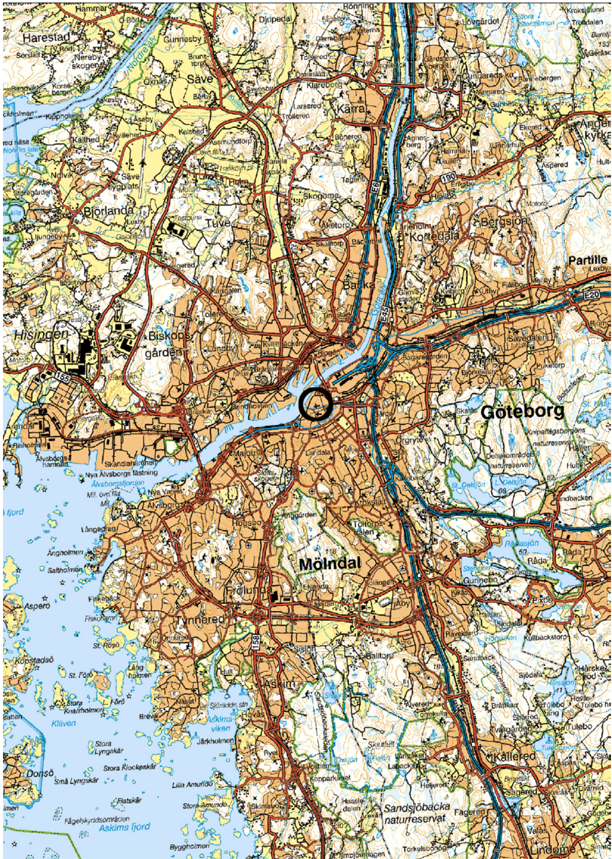
Figur 1. Platsen för undersökningen i centrala Göteborg markerad. Blå kartan. Skala 1: 100 000.