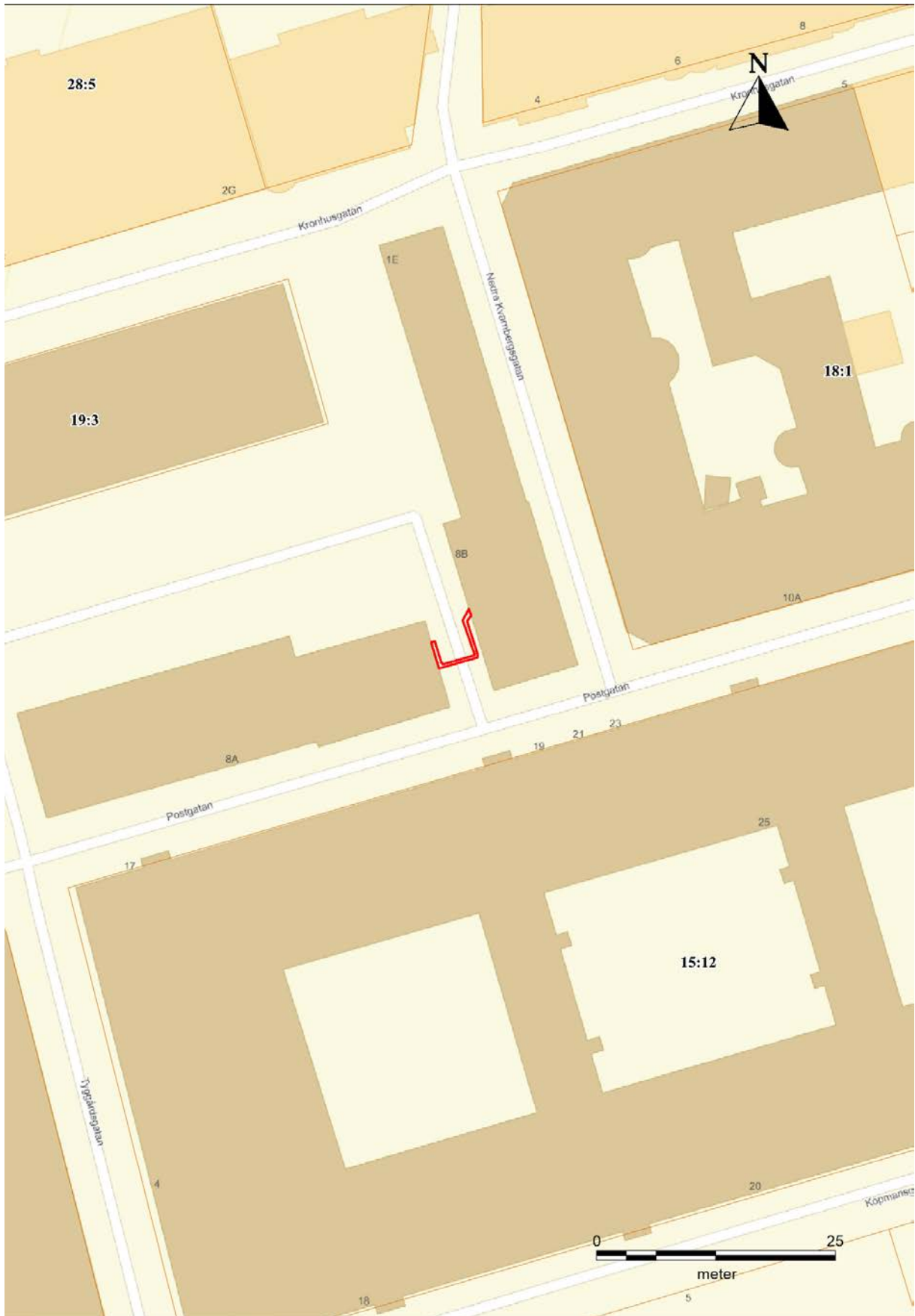
Figur 3. Karta över kv. Kronhuset samt närliggande fastigheter. Schaktet markerat (röd). Skala 1:500.