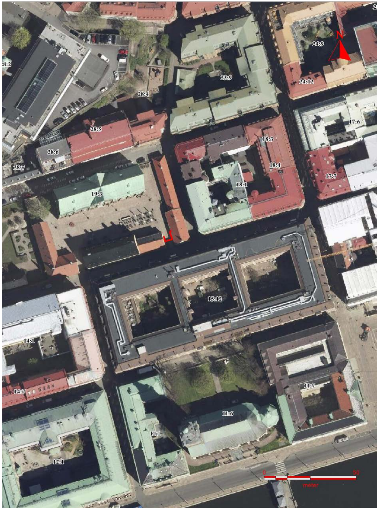
Figur 2. Ortofoto från 2017 över kv. Kronhuset samt närliggande fastigheter. Schaktet markerat (röd). Christinae kyrka i söder samt Ostindiska huset i sydväst. Skala 1:1000.