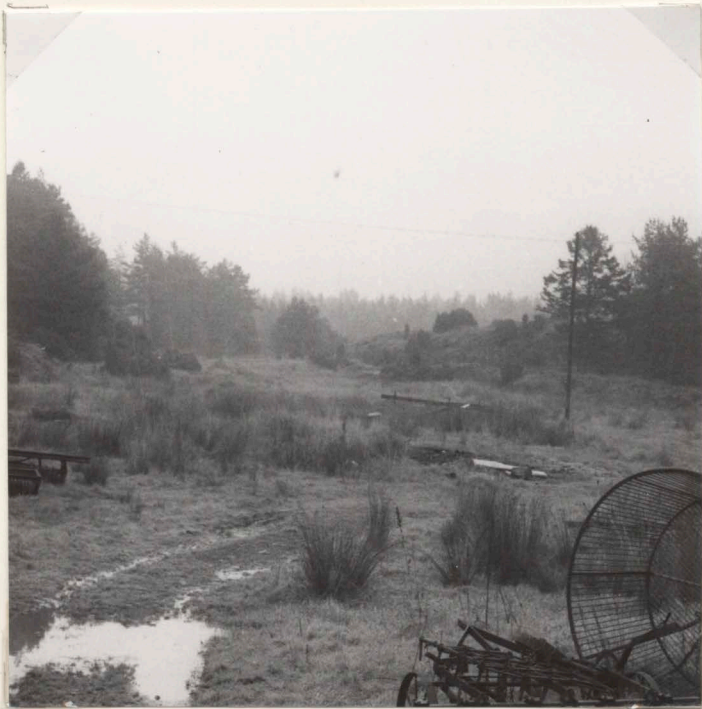
1. Mot väggropsseriens västra del, från V. A 163