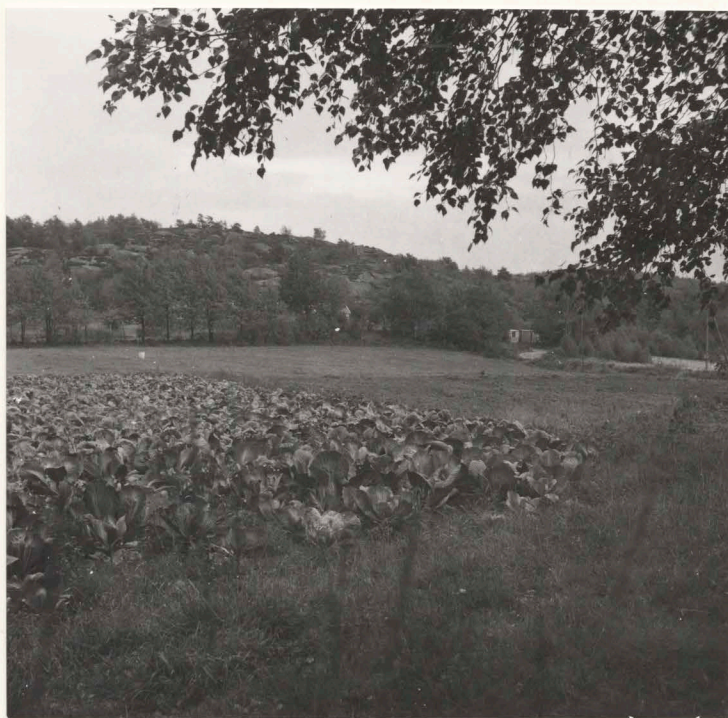
14:S 69 före undersökning, från norr.