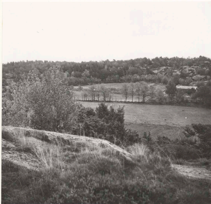
Översikt från bergstopp väster om sommarstugan från sydväst - nordväst.