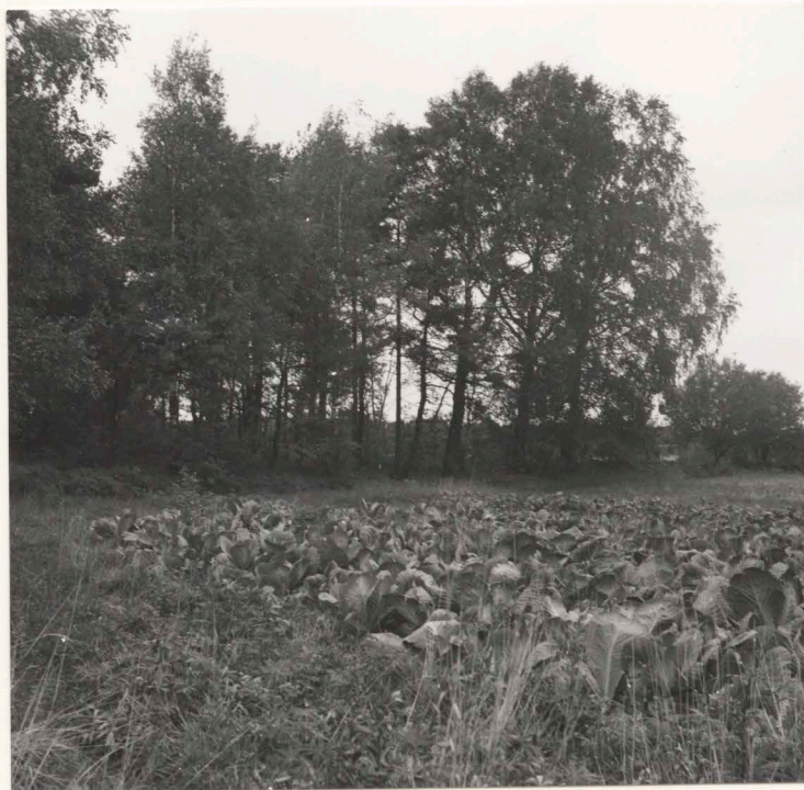
14:S 70 före undersökning från nordväst.