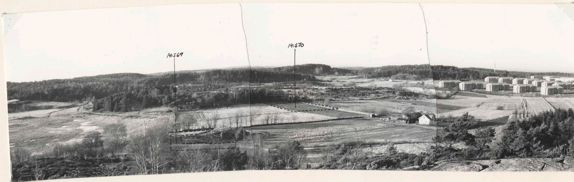
1 . Översikt över dalgången med boplatssområdena 14:S69 och 14:S70. Till vänster Gunnestorps mosse, till höger bebyggelsen i Arvesgårde. Från SSV. K10: 44219 a, -c A 164