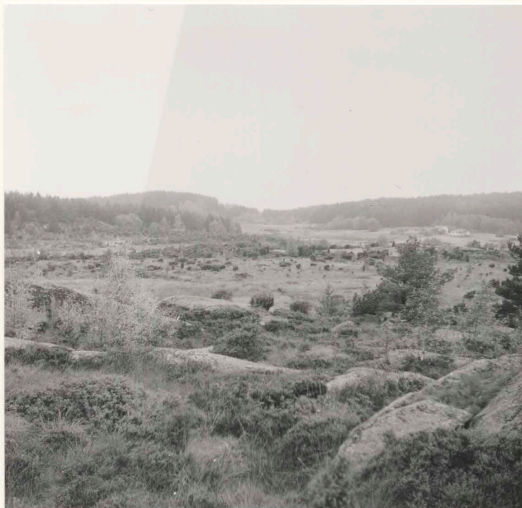
Översikt från bergstopp väster om sommarstugan, mot 14:57-58, 67 från öster.