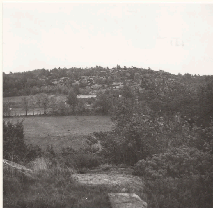
Översikt från bergstopp väster om sommarstugan.