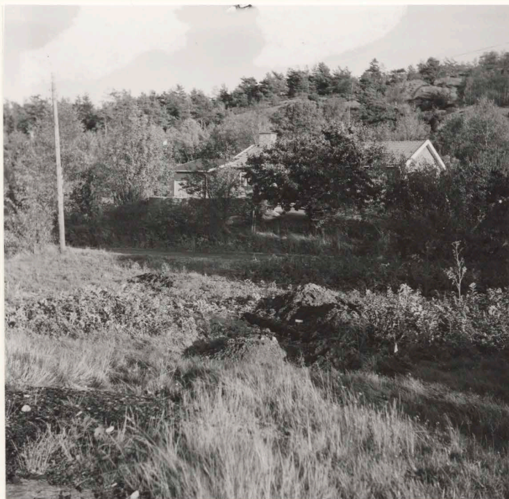
Schaktet på 14:S 69