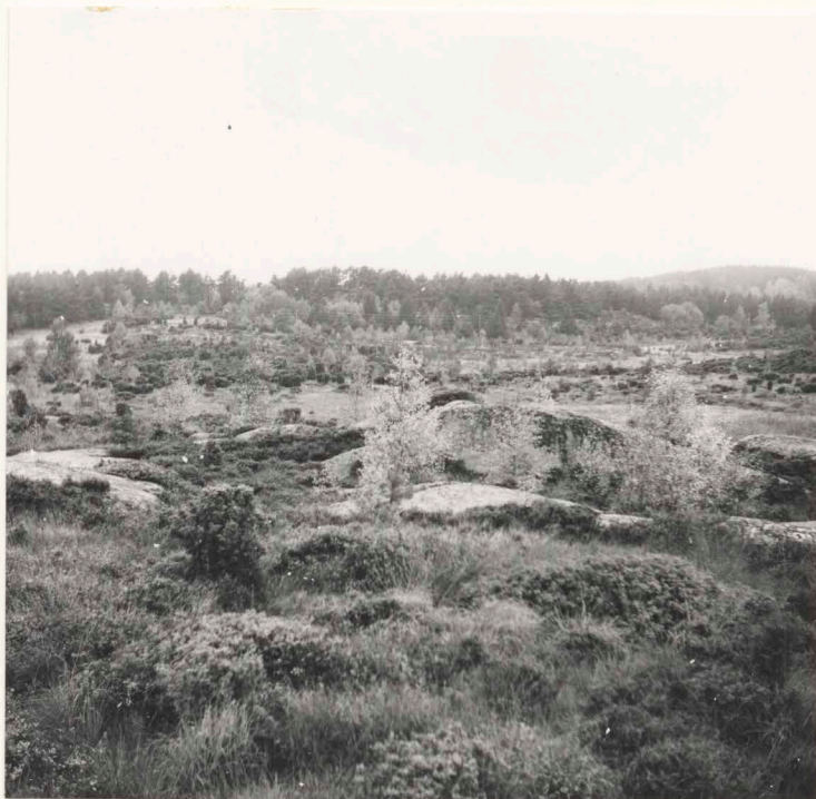
Översikt från bergstopp väster om sommarstugan, mot 14:57-58, 67 från öster.