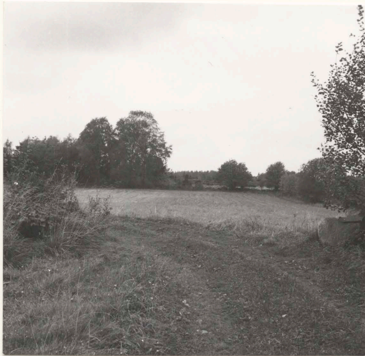
14:S 70 före undersökning, från öster.