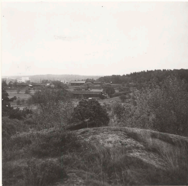
Översikt från bergstopp väster om sommarstugan, från sydväst - nordväst.