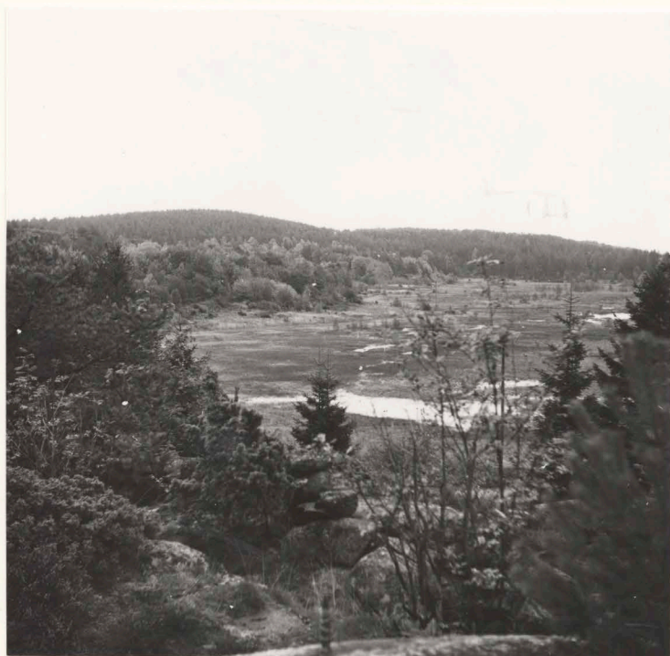
Översikt från bergstopp väster om sommarstugan, från sydväst - nordväst.