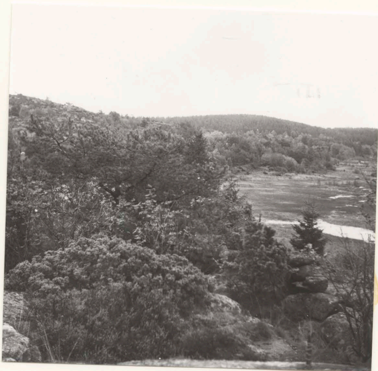
Översikt från bergstopp väster om sommarstugan, från sydväst - nordväst.