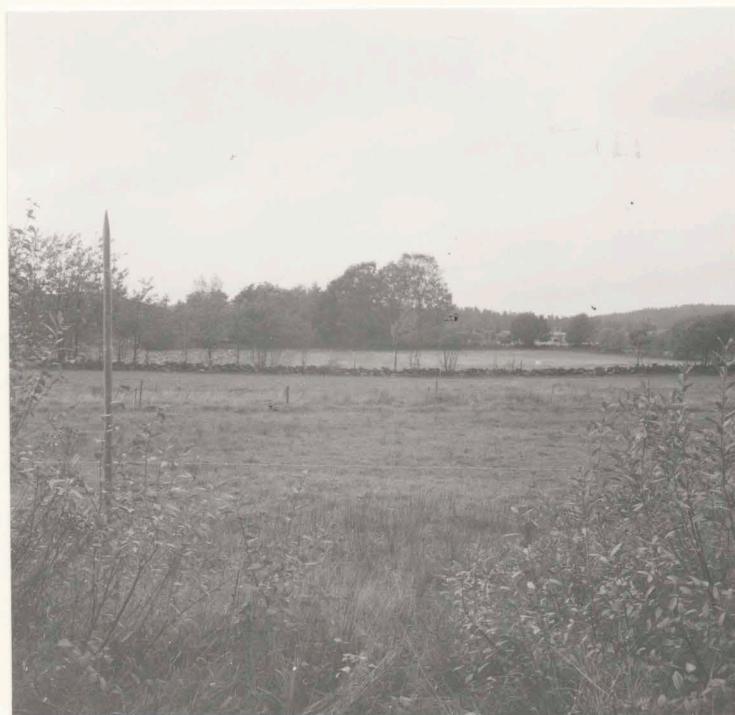
14:S 70 före undersökning, från sydost.