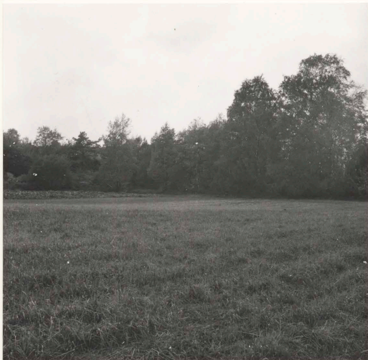
14:S 70 före undersökning, från nordost.