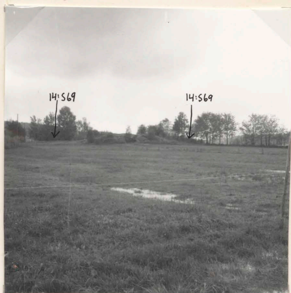
2. Före undersökning. Från NO.