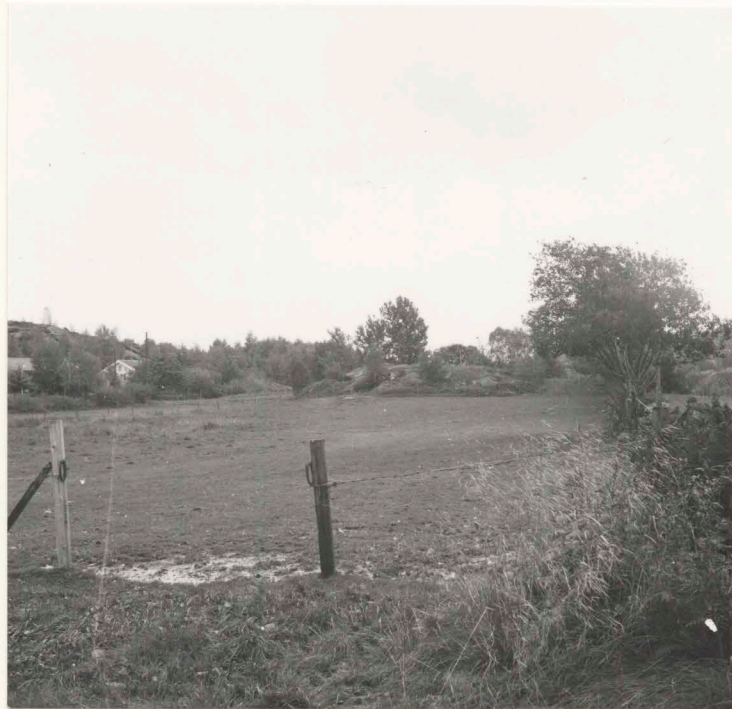
14:S 69 före undersökning, från norr.