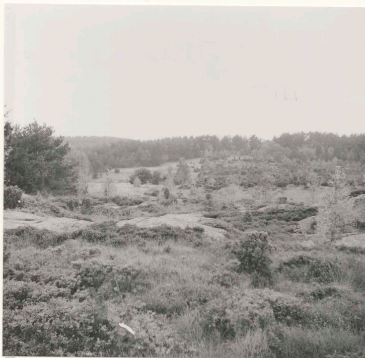
Översikt från bergstopp väster om sommarstugan, mot 14:57-58, 67 från öster.