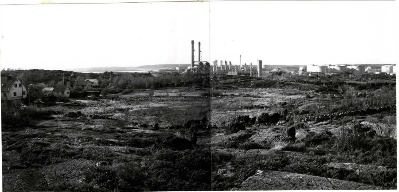
Undersökningsområdet 12:S 3 från öster.