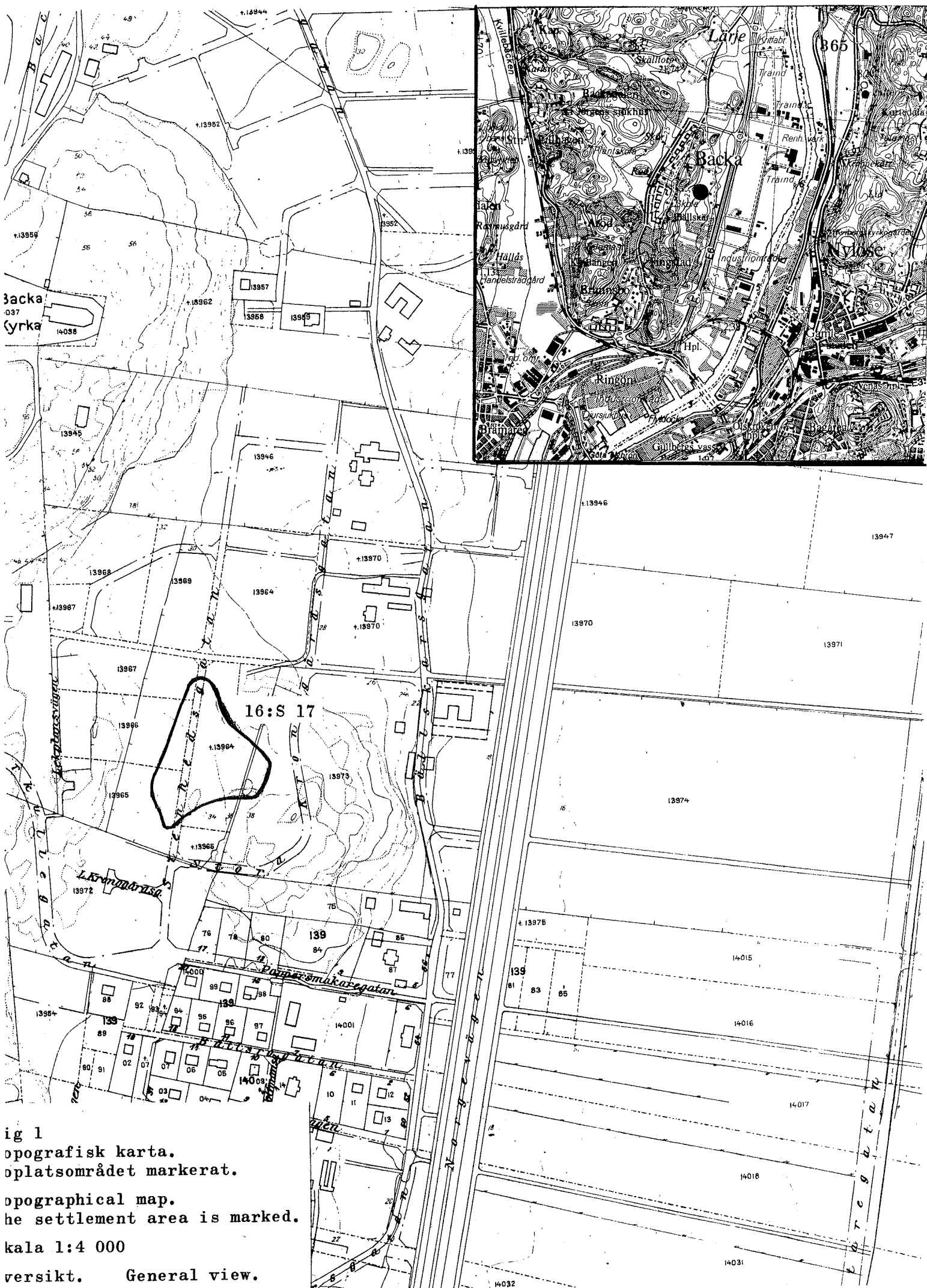
ig 1 opografisk karta. oplatsoområdet markerat. opographical map. he settlement area is marked. kala 1:4 000 versikt. General view.