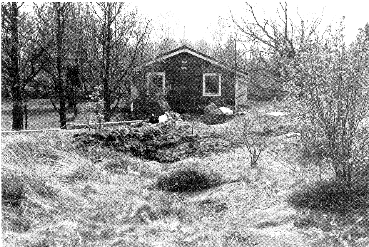
Fig 2. Läget för den undersökta stenpackningen. Mot söder.

nomiska kartan och beskrivs som en delvis övertorvad, oregelbunden stensättning, möjligen en naturbildning. Utifrån museets registerkarta (skala 1:4000) över fornlämningar går det inte att exakt utläsa läget för den eventuella fornlämningen St 64. Vid