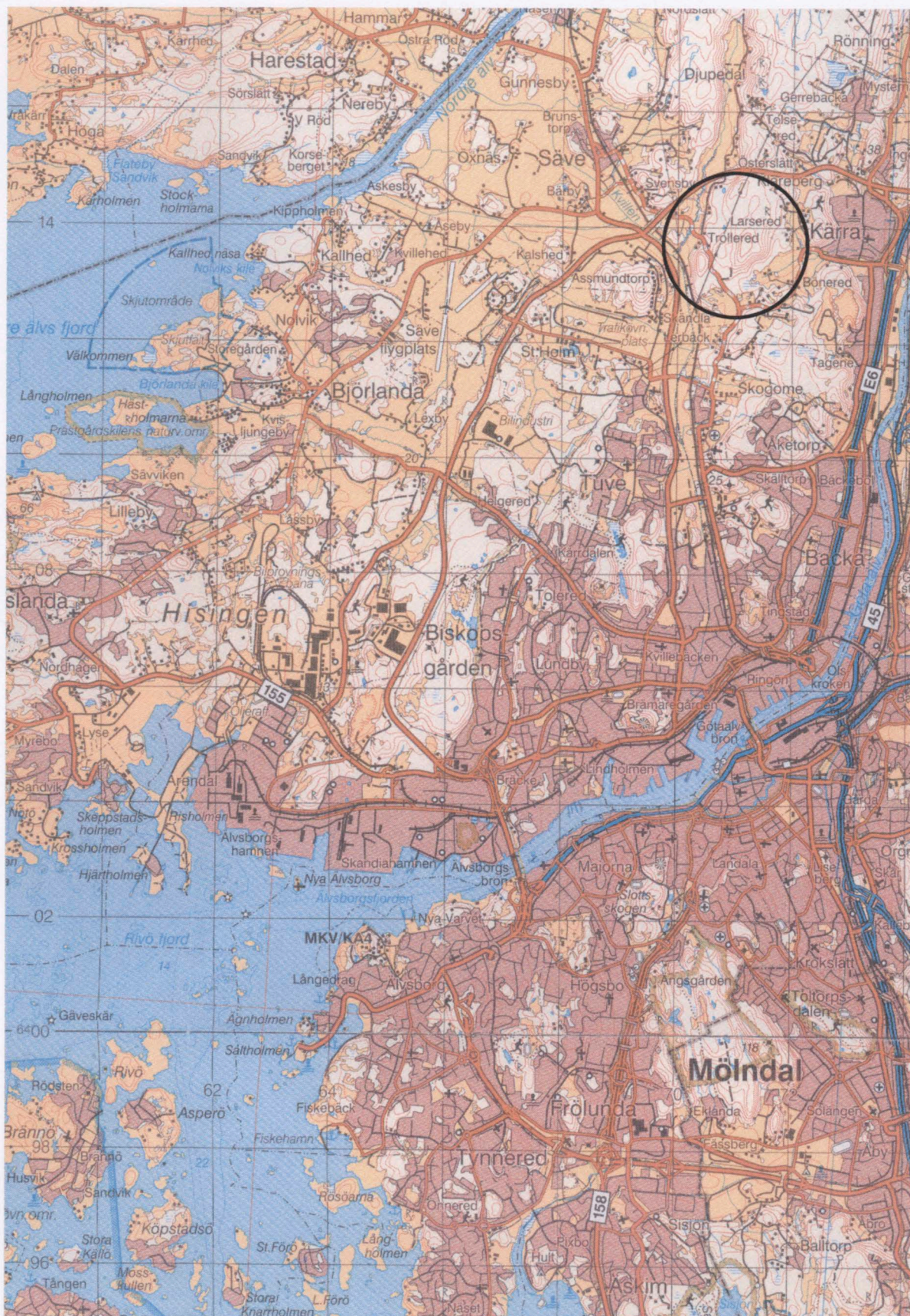
Fig. 1. Utredningsområdet markerat på blå kartan, skala 1:100 000.