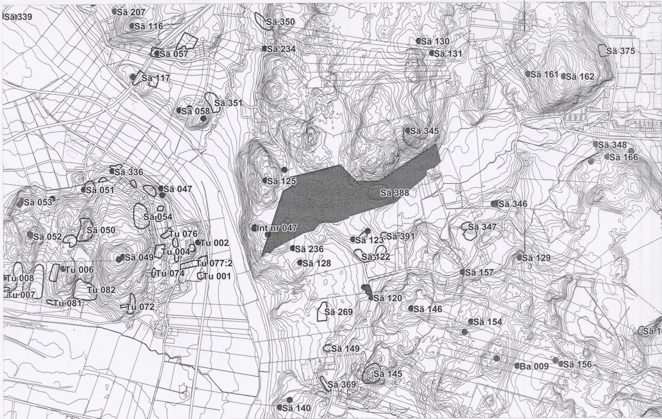
Fig. 2. Utredningsområdet markerat på karta över Göteborgs kommun, skala 1:10 000