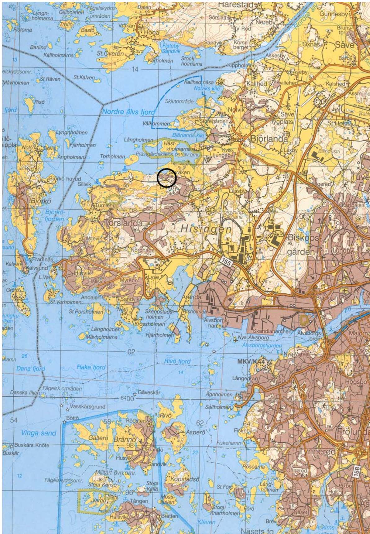
Fig. 1. Fornlämningsområdets läge på västra Hisingen i Göteborg. Skala 1:100 000.