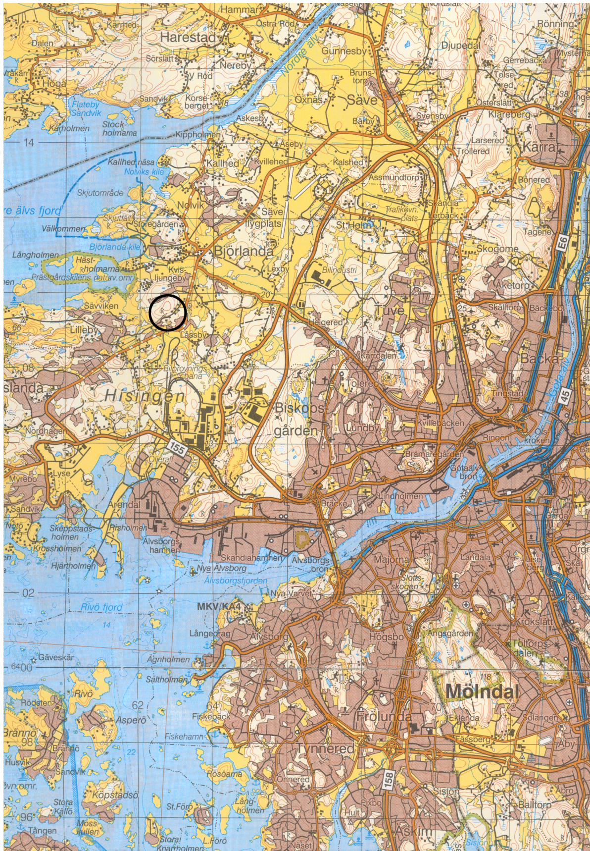
Fig. 1. Undersökningens läge på sydvästra Hisingen i Göteborg. Blå kartan skala 1:100 000.