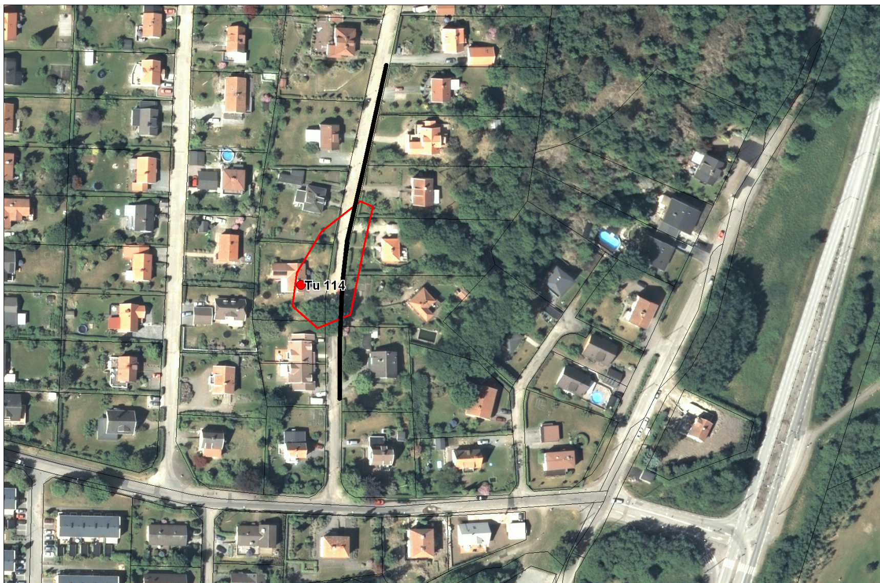
Fig. 2. Det dokumenterade VA-ledningsschaktet i Åslyckevägen markerat med svart linje. Fornlämningens nya utsträckning markerad med röd linje.