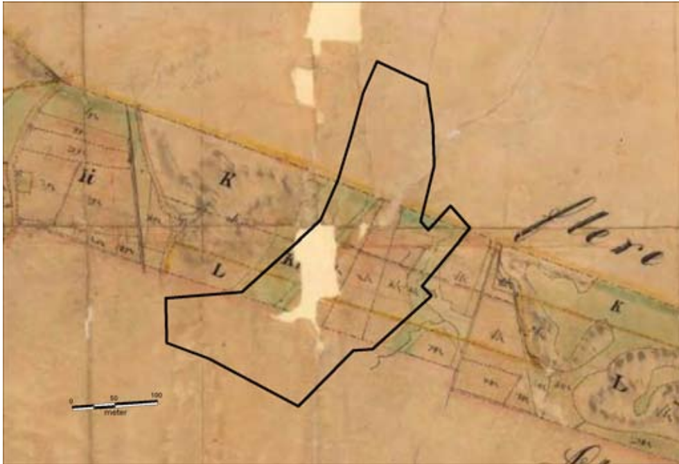
Fig. 6. Utredningsområdets gräns lagd på Laga skifteskarta från 1851.