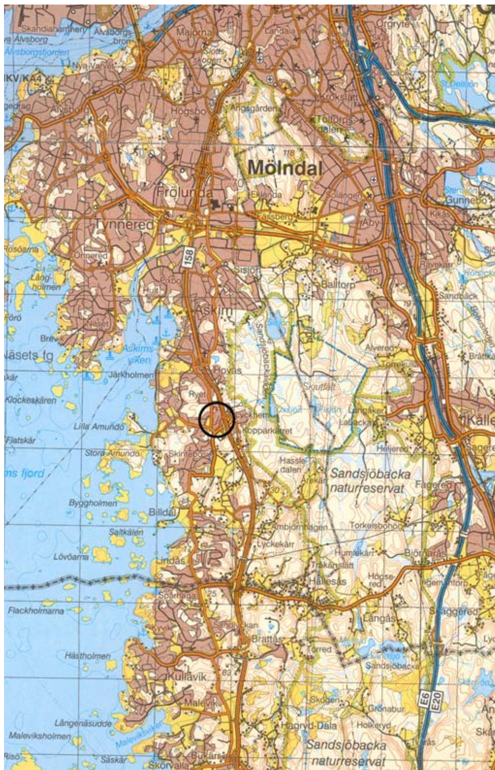
Fig. 1. Platsen för den arkeologiska utredningen markerad på blå kartan. Skala 1:100 000.