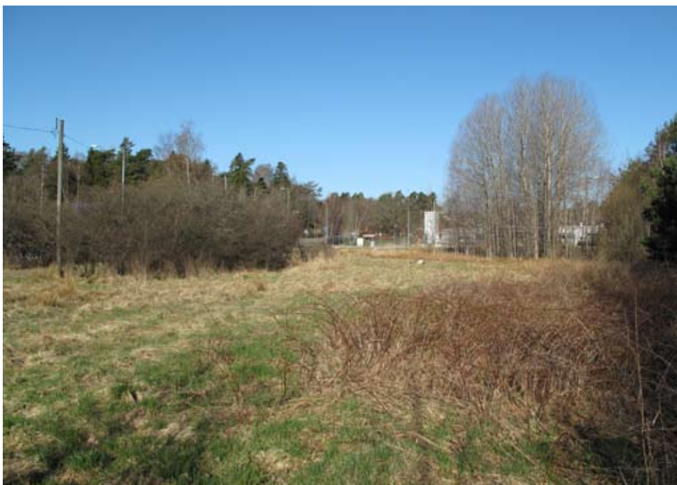
Fig. 8. Platsen för schakt 2 och den nypåträffade forntida boplatslämningen. Foto mot väster.

I det utvidgade schakt 2 påträffades ett kulturlager och förhistoriska anläggningar under tjocka påförda jordmassor (fig. 8). Kulturlagret innehöll enstaka slagna flintor. Anläggningarna låg i leran under kulturlagret. En av anläggningarna utgjorde av allt att döma ett stolphål (fig. 9). Boplatsens läge på lera och det enkla fyndmaterialet av slagen flinta tyder på att boplatslämningen hör hemma i bronsålder eller den äldsta järnåldern. Boplatsens utbredning fastställdes inte vid utredningstillfället.