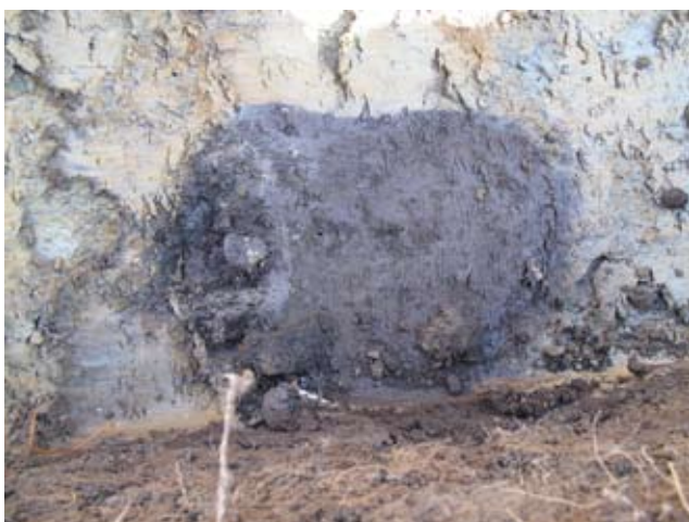
Fig. 9. Ett stolphål fyllt med mörk sotig jord påträffades i schakt 2.