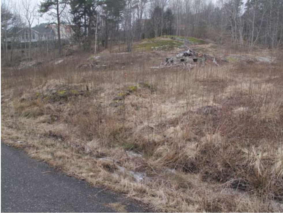
Fig. 4. Norr om Björklundavägen som gick genom utredningsområdet fanns ruiner av senare tids bebyggelse. Foto mot nordväst.