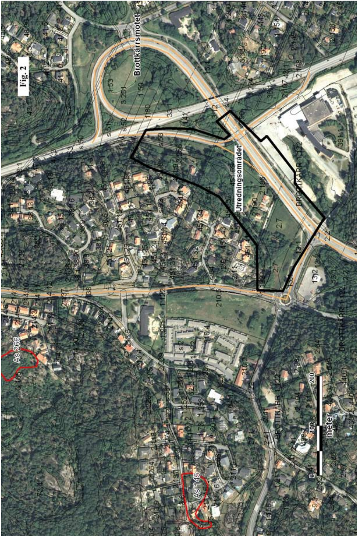
Fig. 2. Utredningsområdet ved Brottkærsmotet i Hovås.