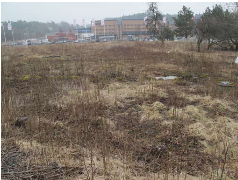
Fig. 3. En stor del av utredningsområdet utgjorde igenväxande åker- och ängsmark. Foto mot söder.

Det fanns inte så många fornlämningar i direkt anslutning till utredningsområdet. De närmast belägna var ett röjningsröseområde ca 500 m i nordvästlig riktning (As 266), en boplats från äldre stenålder ca 500 i västlig riktning (As 145) samt ett boplatskomplex med dateringar från både sten-, brons- och järnålder ca 500 m i sydostlig riktning (As 270, 271, 296). Några arkeologiska undersökningar har inte tidigare gjorts inom utredningsområdet.