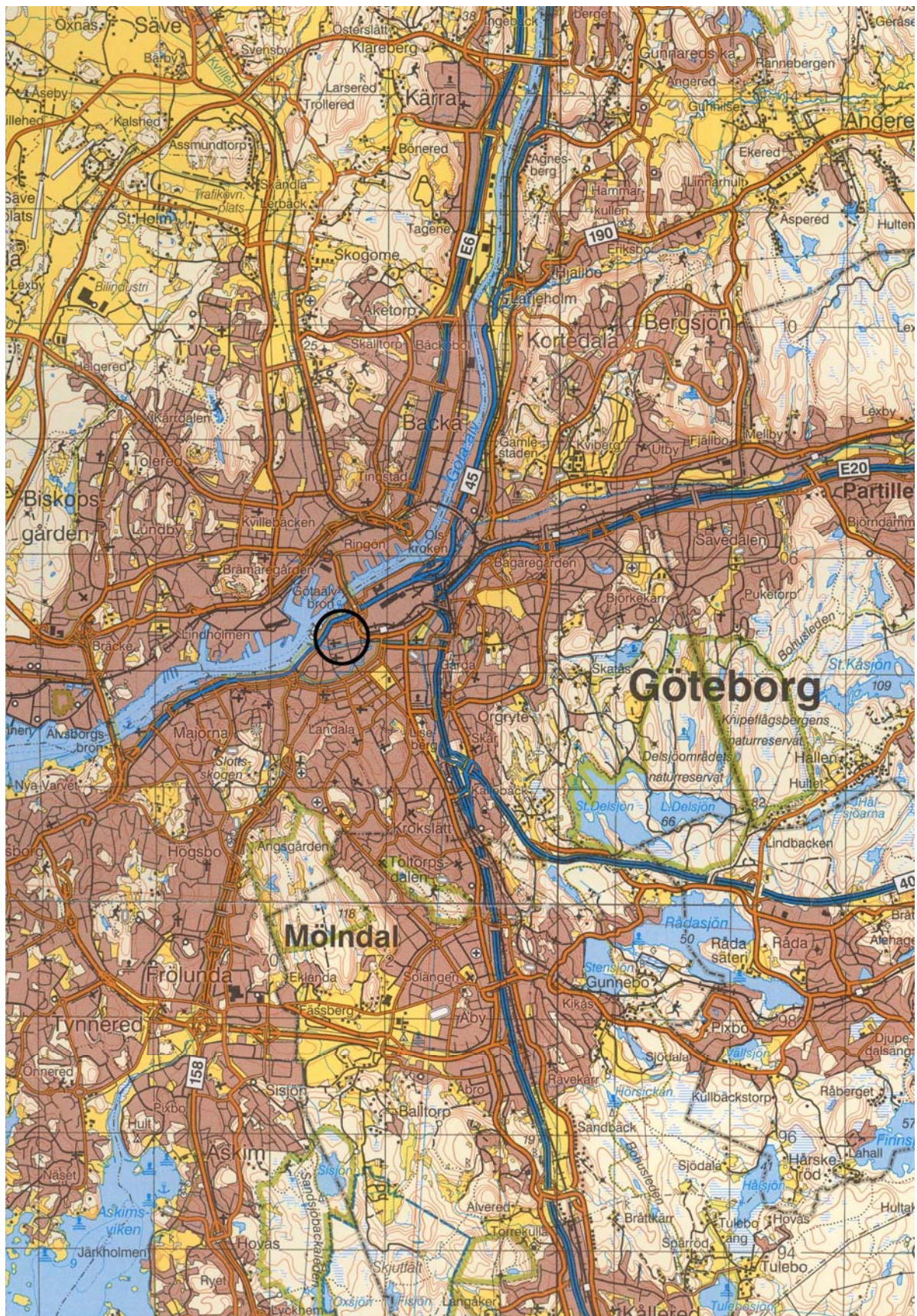
Bilaga 1. Översikt.