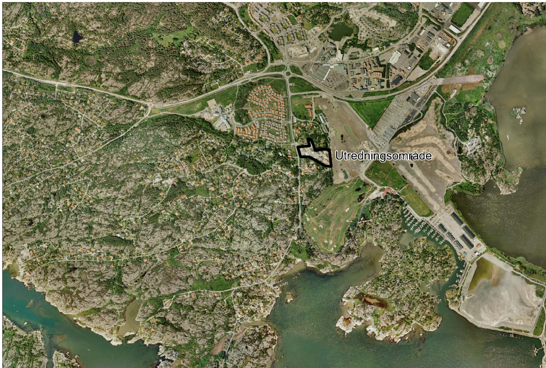
Fig. 2. Utredningsområdet markerat. Skala 1:20 000.