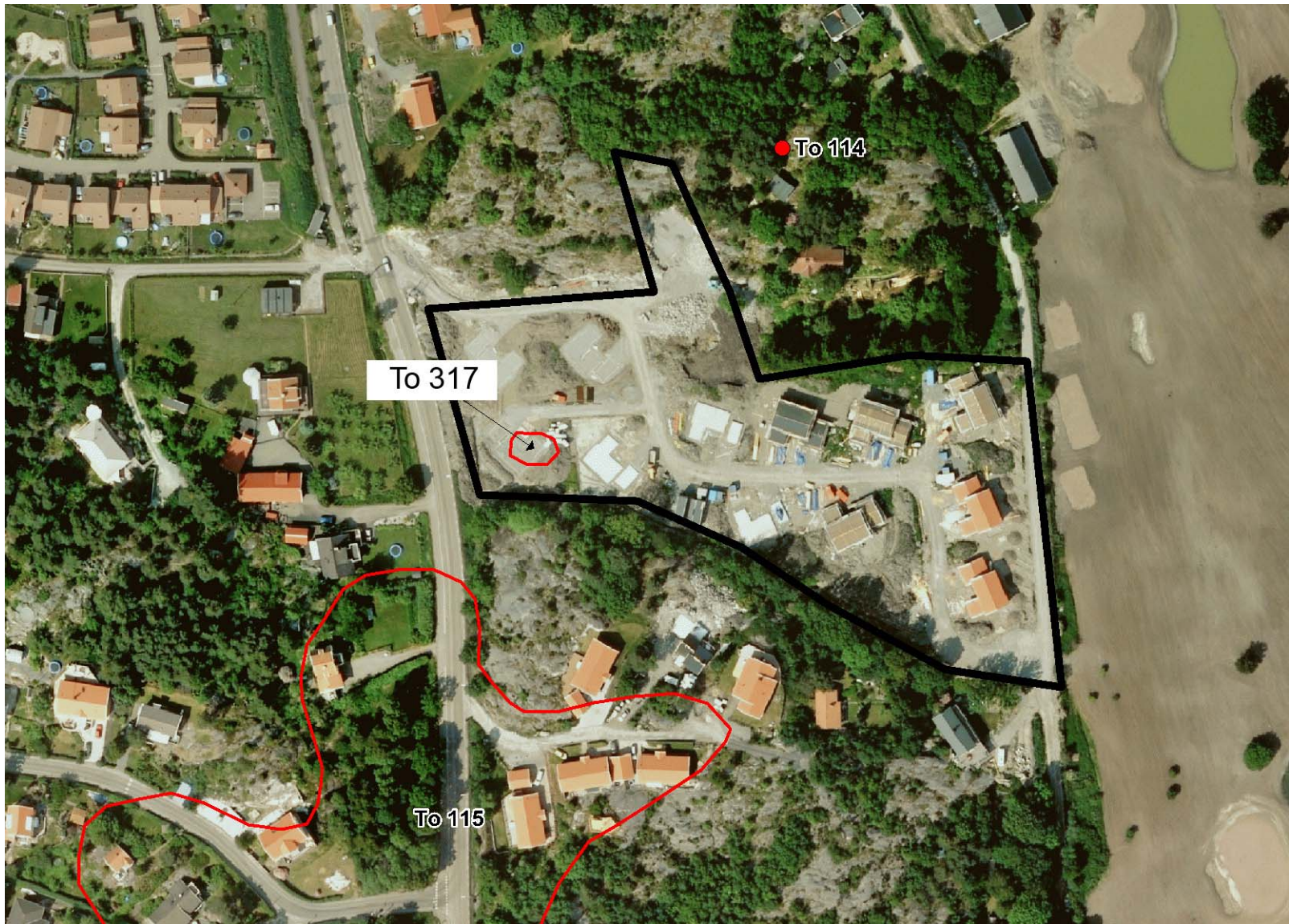
Fig. 3. Utredningsområdet och den slutundersökta boplatsen Torslanda 317 markerade. Skala 1:2000.