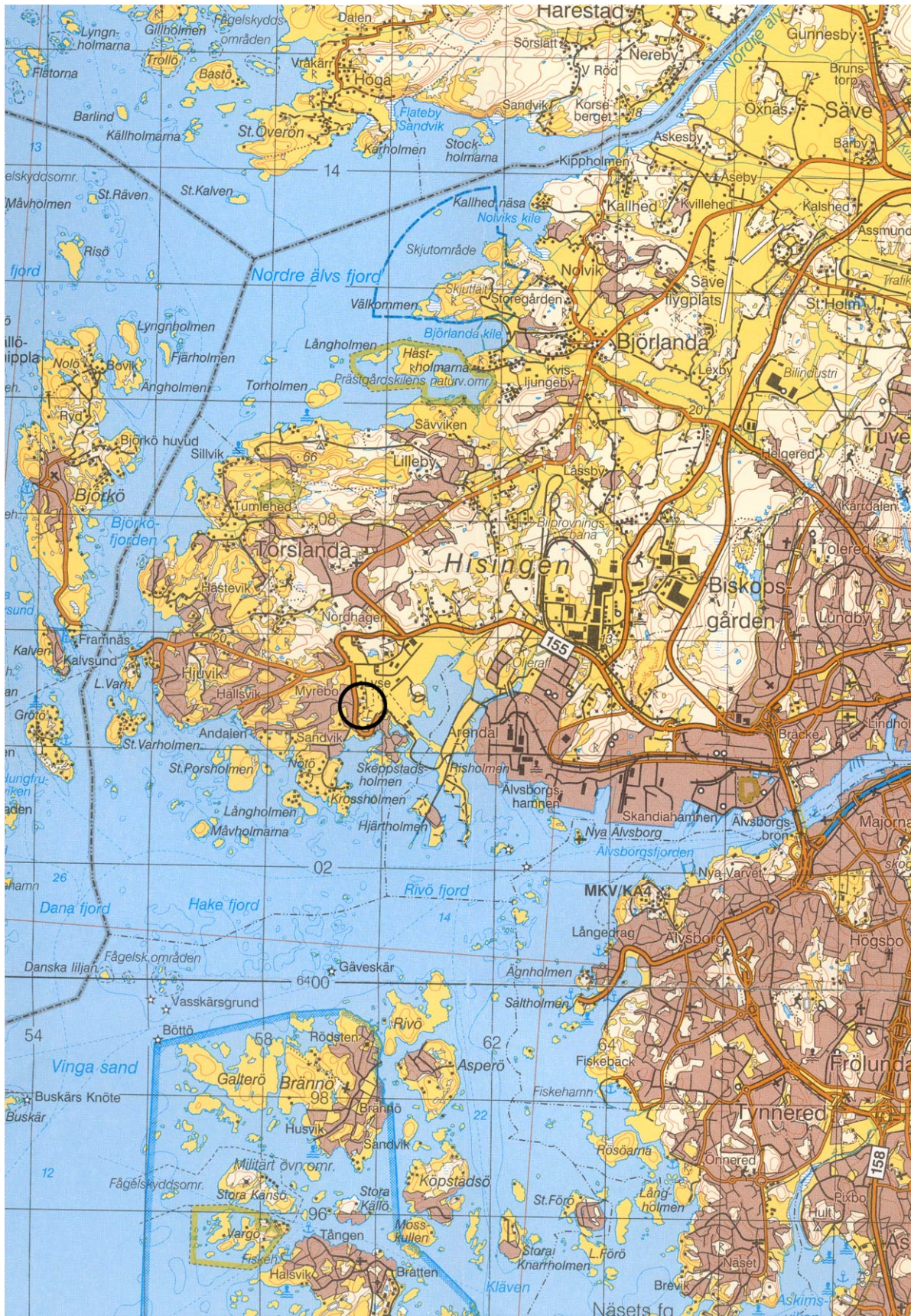
Fig. 1. Undersökningens läge på sydvästra Hisingen i Göteborgs kommun. Blå kartan, skala 1:100 000.