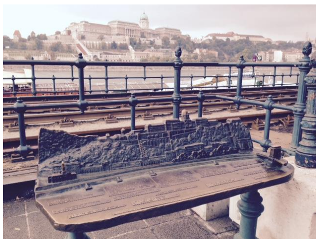
Exempel på hur man i Budapest presenterar historia i stadsmiljö.

Även om det inte varit en stor del i arbetet med denna rapport vill vi även säga något om hur andra städer runt om i världen har gestaltat information om olika delar av stadens historia. Runt