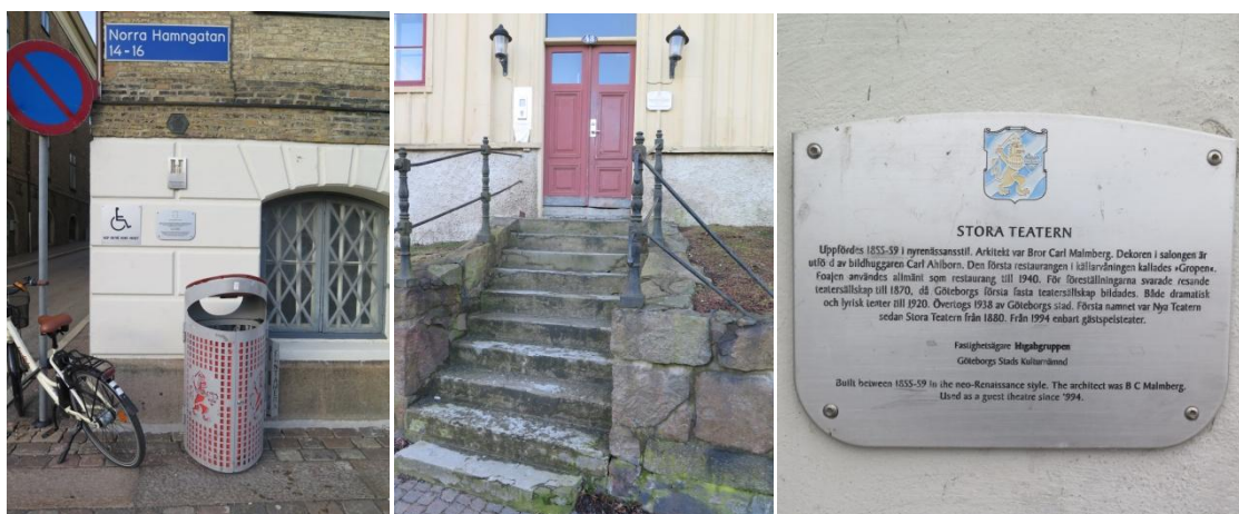
Bild t.v. exempel på otillgänglig skylt på grund av soptunna, i mitten svårtillgänglig på grund av placering ovanför smal trapp utan ramp, t.h. exempel på där engelsk text är uppenbart mer kortfattad.

Även när det kommer till tillgängligheten rent fysiskt till skyltarna så finns en del anmärkningar att göra. Några skyltar sitter uppsatt bakom en soptunna eller ett cykelställ, flera skyltar sitter intill entréer utan ramp ett antal trappsteg ovanför gatunivå och ett antal sitter uppsatta bakom pelare eller liknande.