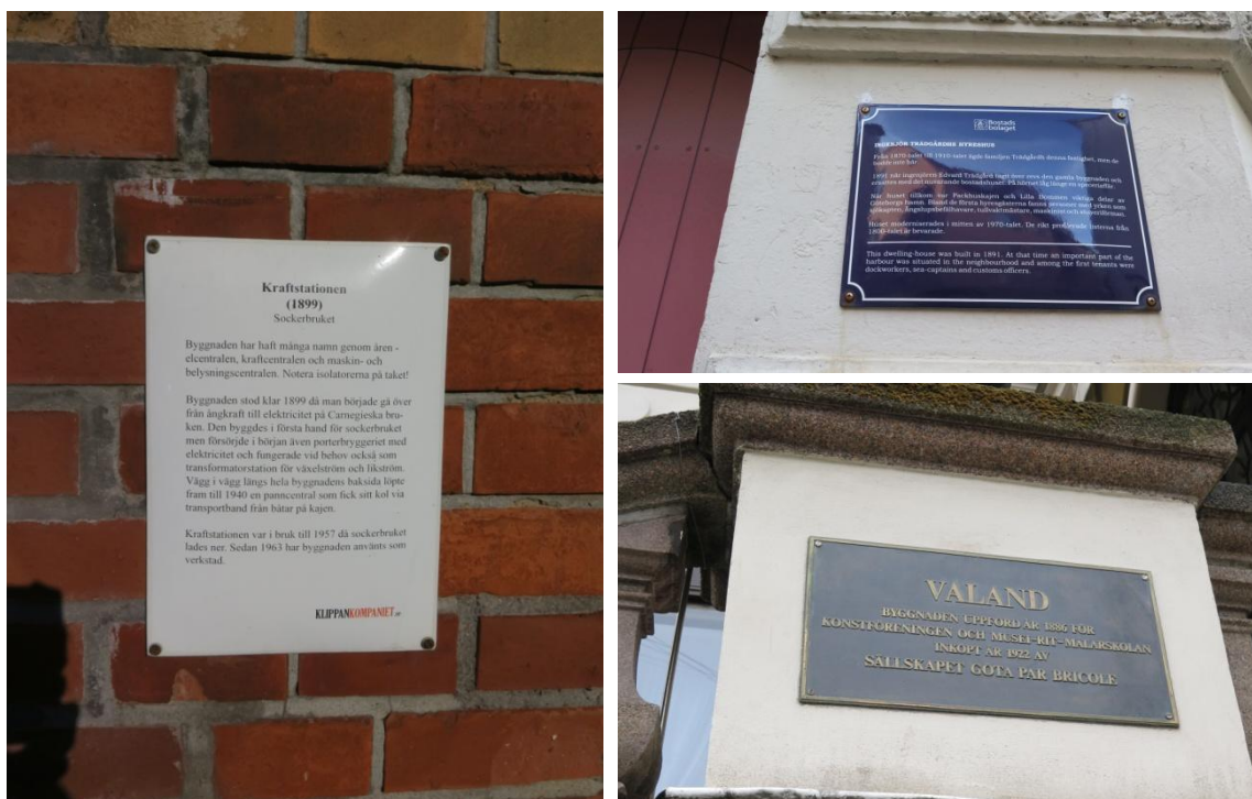
Tre exempel på andra typer av skyltar med historisk information i Göteborgs stadsrum.

De mest ambitiösa skyltarna som stötts på under inventeringen är dem som sitter på fasaderna på byggnaderna i kulturreseptatet Klippan. Här finns en skylt till varje hus som berättar mer ingående om just det husets roll och funktion i hela anläggningen. Sådana skyltar blir helt naturligt mer djuplodande i sin information än vad en skylt för hela området skulle kunna vara. Möjligen är det därför ingen skylt för 100 utmärkta hus finns uppsatt i området, trots att Klippan ursprungligen var ett av "husen" som skyltades upp.