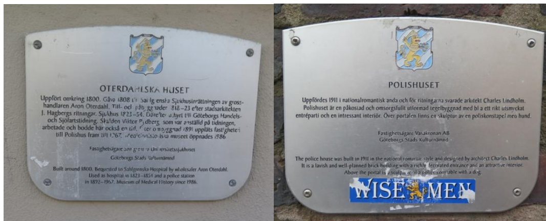
Två skyltar med olika typer av skador. T.v bortnött färg i texten och t.h påklistrat klistermärk och missfärgningar. Båda är även blekta i färgen.

Ett antal av de uppsatta skyltarna är å sin sida skadade efter mänsklig påverkan. Rispingar i metallen, klotter, målarfärgsstänk och klistermärken (Både påklistrade och rester utav) påverkar i olika grad, och på olika antal, skyltarnas skick.