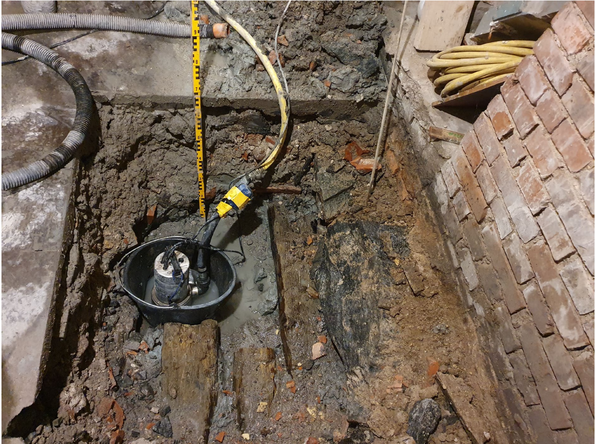
Figur 4. Provgropen efter schaktning. Rustbädden till det befintliga huset syns tydligt i botten. Foto mot väst.