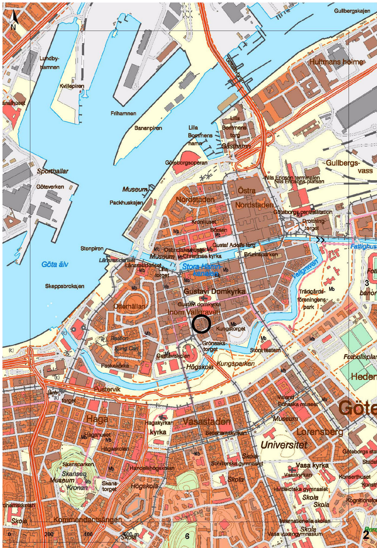
Figur 2. Undersökningsområdets läge i centrala Göteborg markerat. Topografiska kartan, skala 1:10 000.