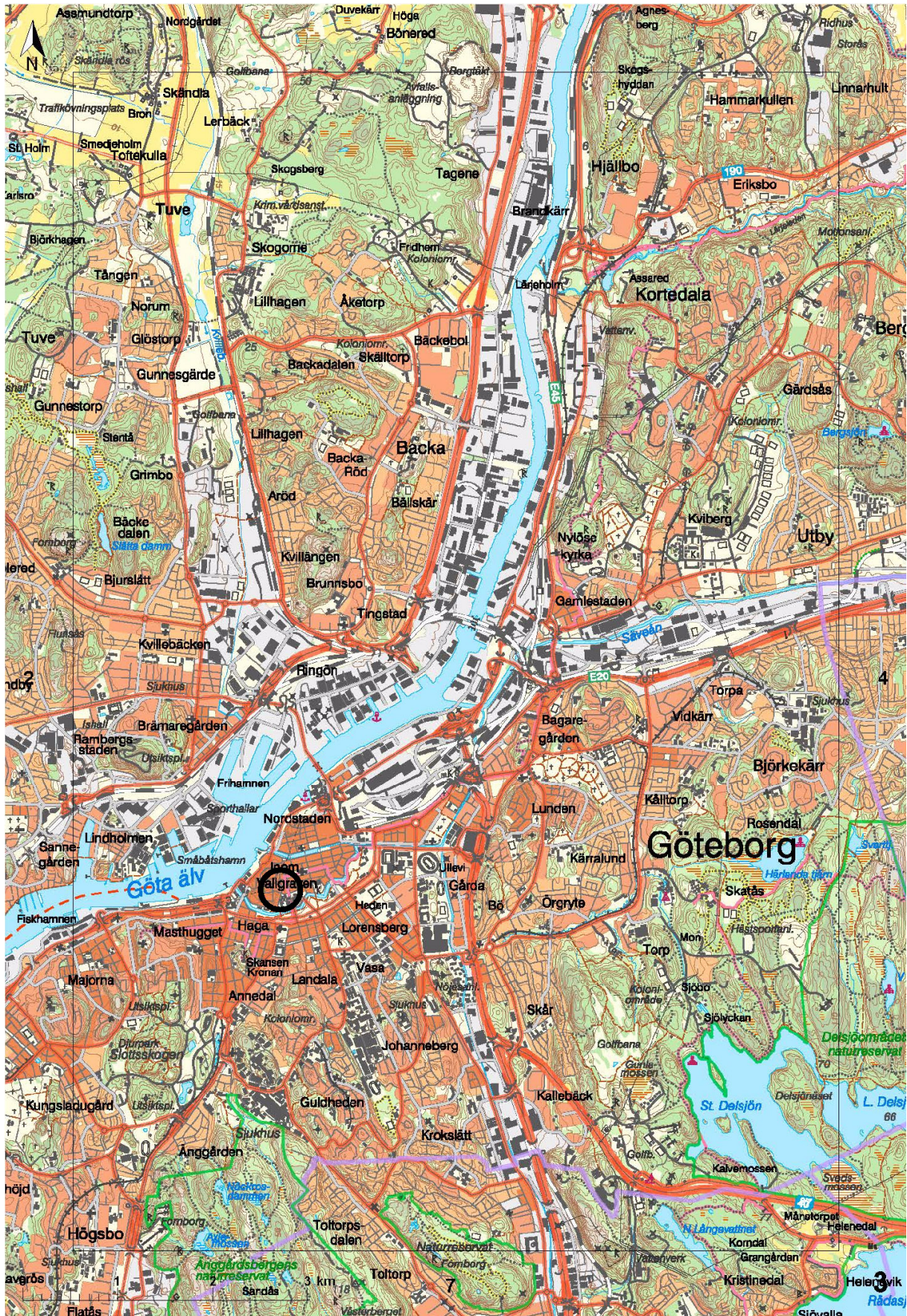
Figur 1. Undersökningsområdets läge i centrala Göteborg markerat. Topografiska kartan, skala 1:50 000.