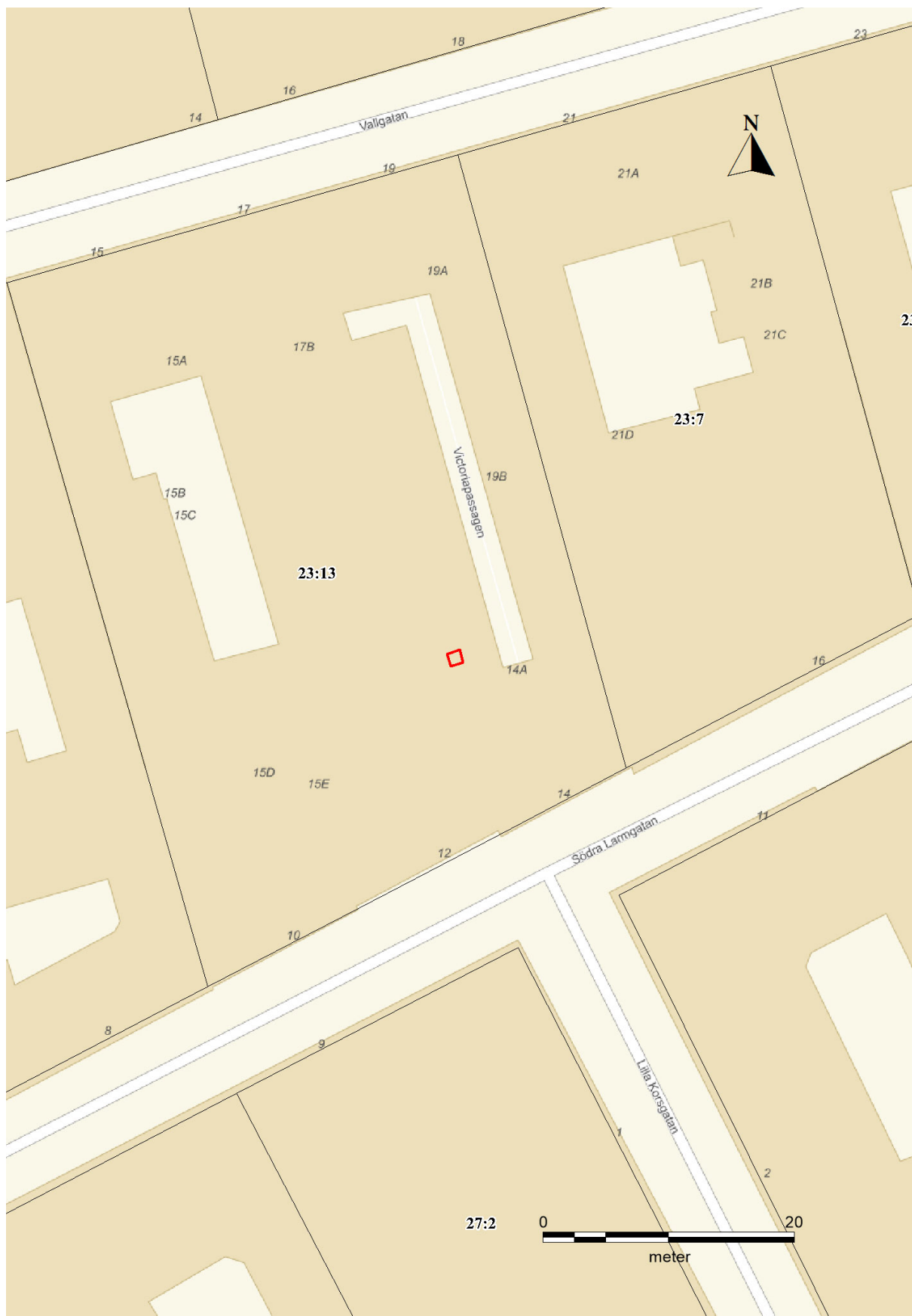
Figur 3. Provgropens placering inom den aktuella fastigheten vid Victoriapassagen markerad (röd). Skala 1:400.