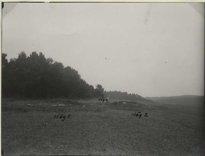
C 1514 Plåt n:r 980.

Högarna 1 o. 2 i förgrunden. I bakgrunden i åkerkanten hög 4. (fr. S)