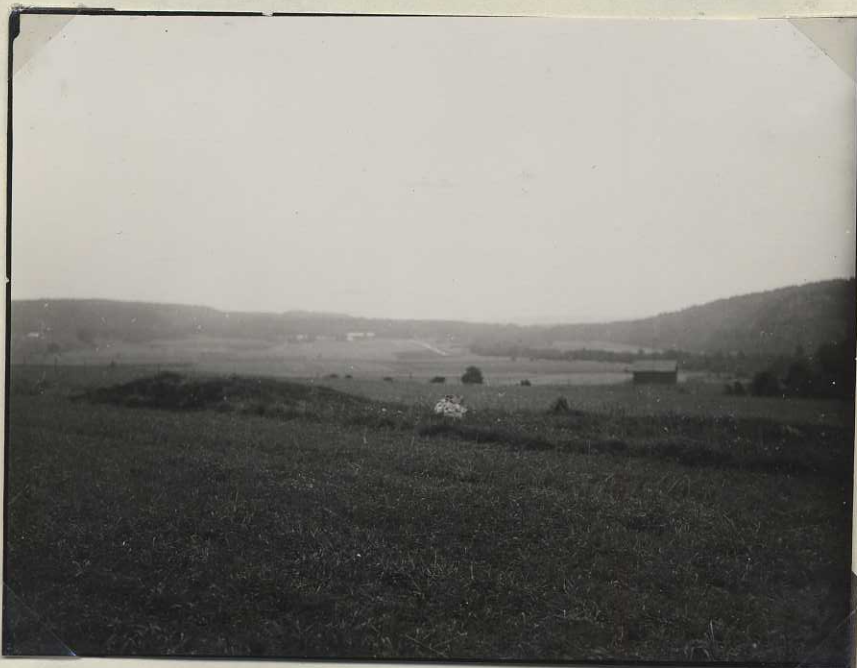
C 1515 Plåt n:r 981.

Högarna 1 o. 2 i förgrunden. I bakgrunden i åkerkanten hög 4. (fr. S)