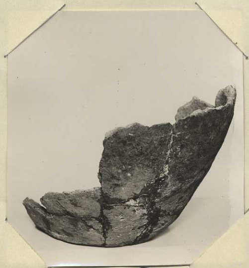
Plåt nr C 64.