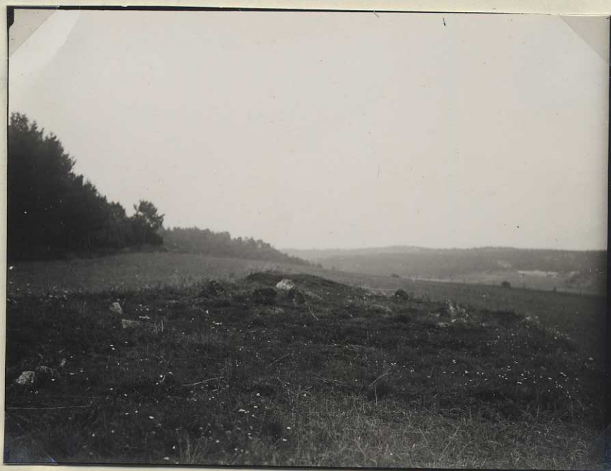
C 1516 Plåt n:r 982.

Hög 2. Till höger om denna ett par av de jordfasta ste- narna. (fr. V)