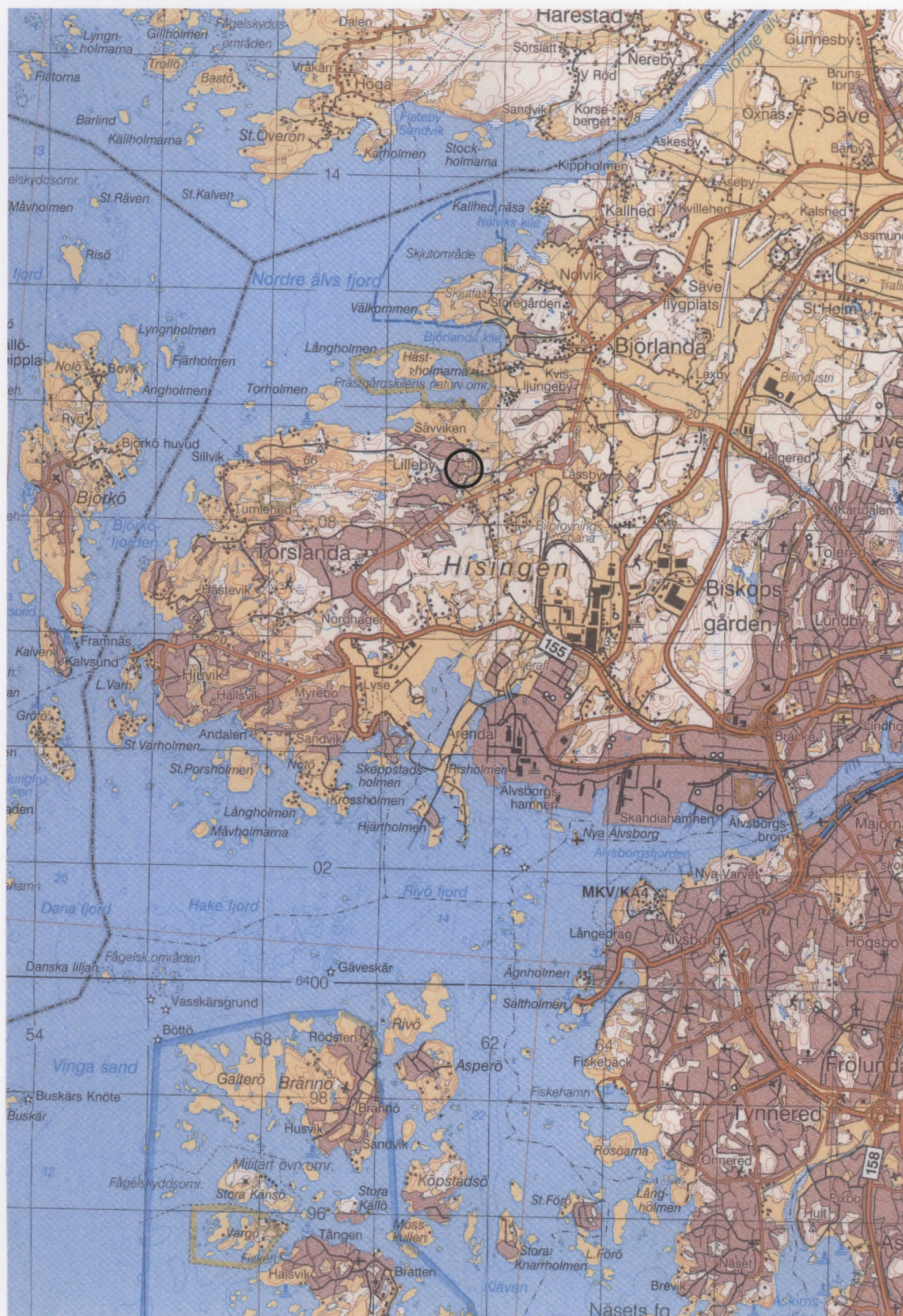
Fig. 1. Förundersökningsområdet markerat på blå kartan, skala 1:100 000.