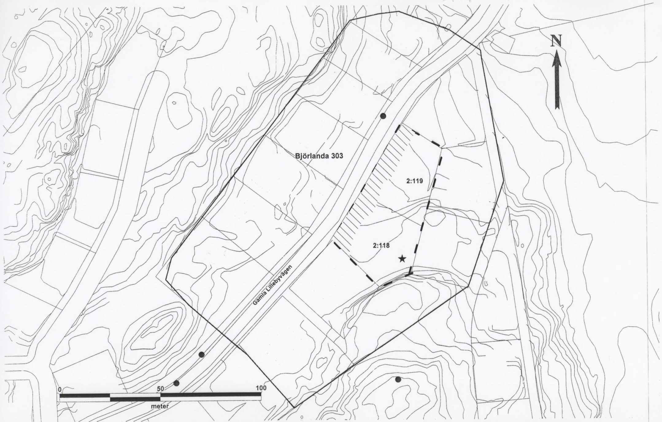
Fig. 3. Fornlämningen Björlanda 303 med fastigheterna Kvislungeby 2:118 och 2:119, vilkas gräns utgör undersökningsområdets utbredning. Skraffering visar ungefärligt läge för kulturlagerrest och stjärna visar ungefärligt läge för historisk husgrund.