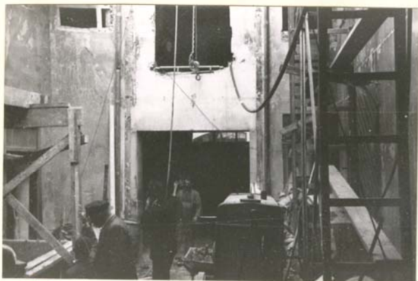
R 353: 13a 4