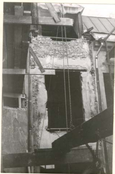
R 353: 17a