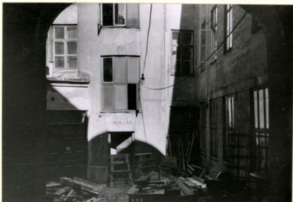
R 353: 21a 4