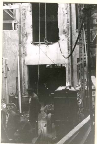
R 353: 12a 4