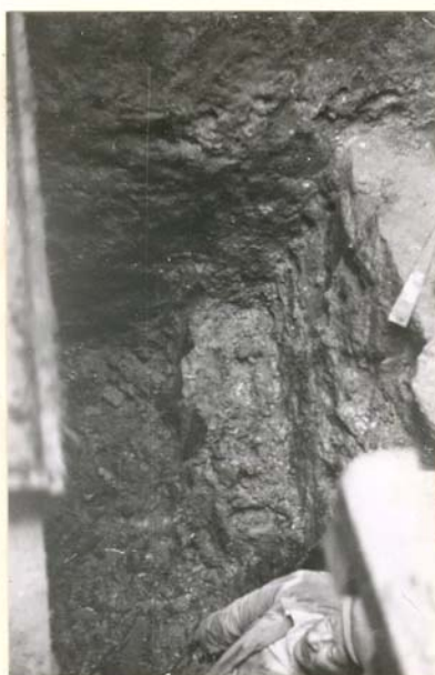
Schaktet sett fr. NV.