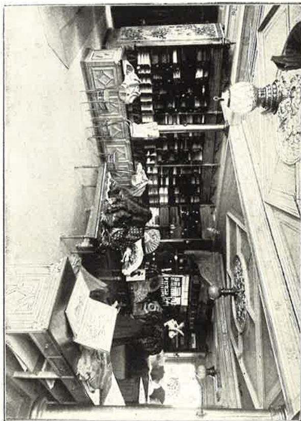
Afdelning för Klädningsstyger.